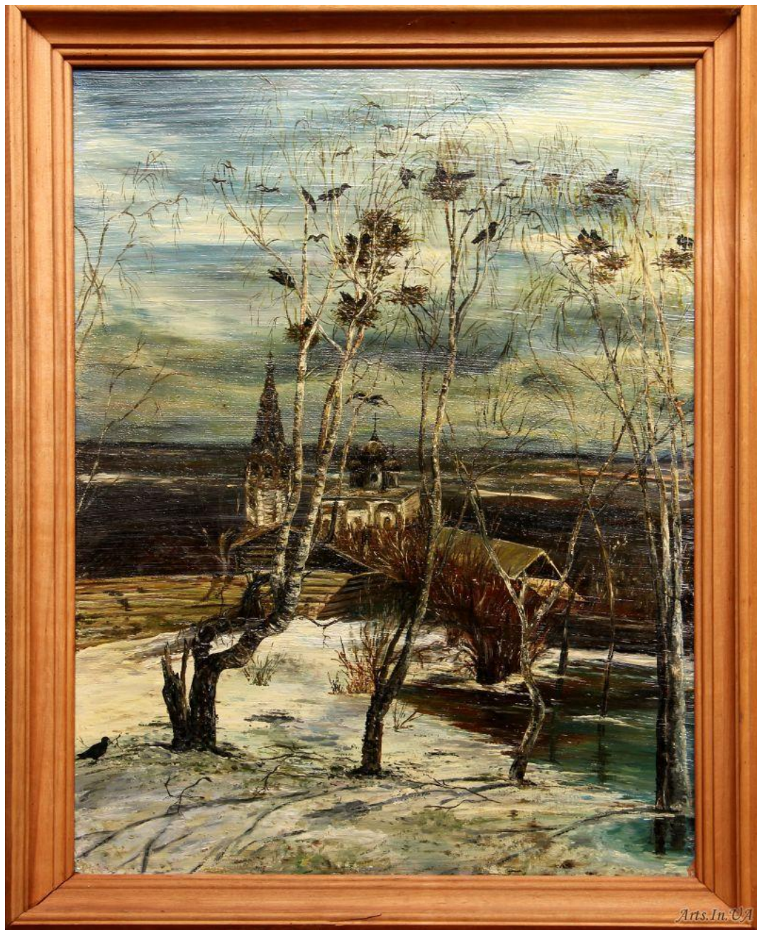
Воскресенская церковь села Сусанино Костромской области