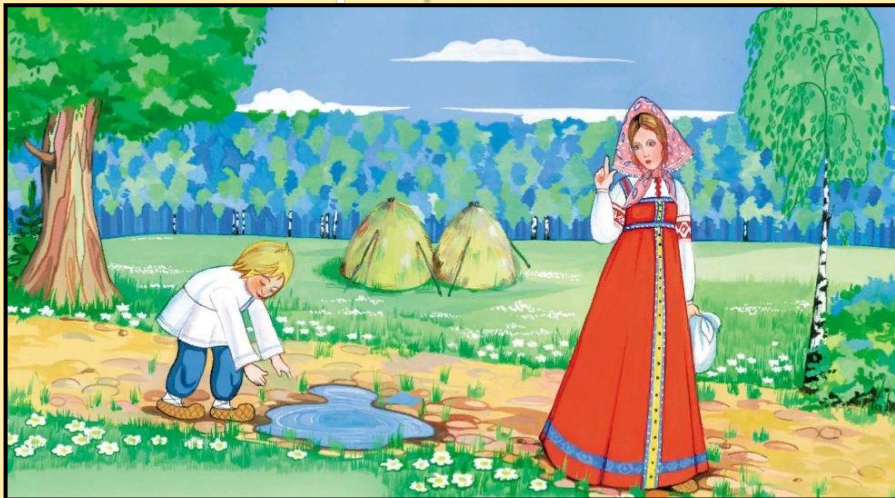
Сестрица Алёнушка и братец Иванушка