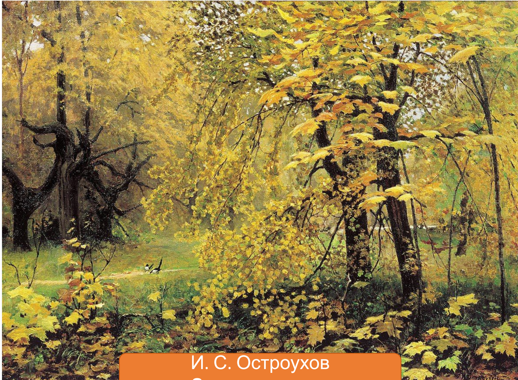
И. С. Остроухов «Золотая осень»