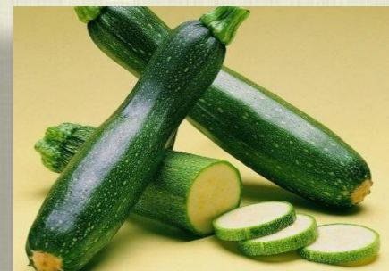
Блюда из кабачков