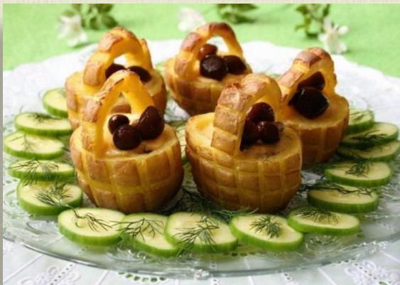
Горячая закуска «Лукошко»