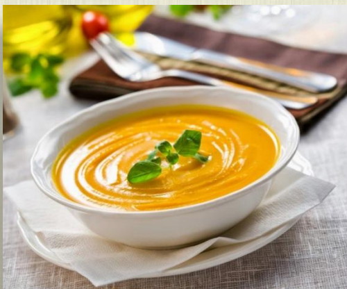
Суп - пюре