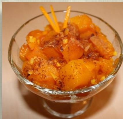
Десерты из тыквы