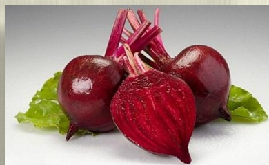
Блюда из свеклы