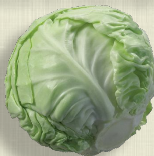
Блюда из капусты