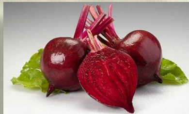
Блюда из свеклы