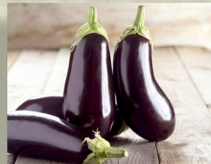
Блюда из баклажанов