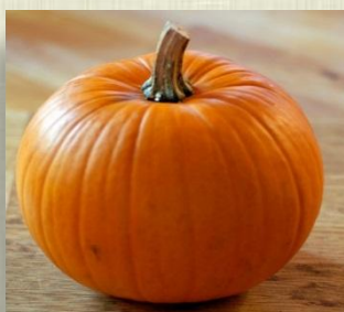
Блюда из тыквы