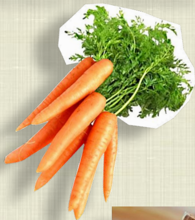
Блюда из моркови