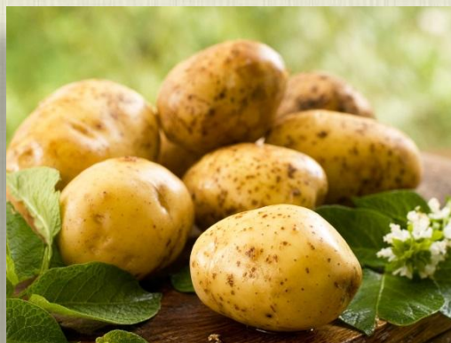
Блюда из картофеля