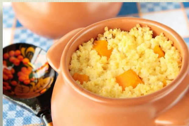
Каша пшенная с тыквой