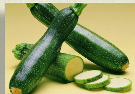
Блюда из кабачков