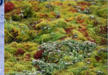
Мхи и лишайники