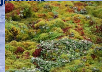
Мхи и лишайники