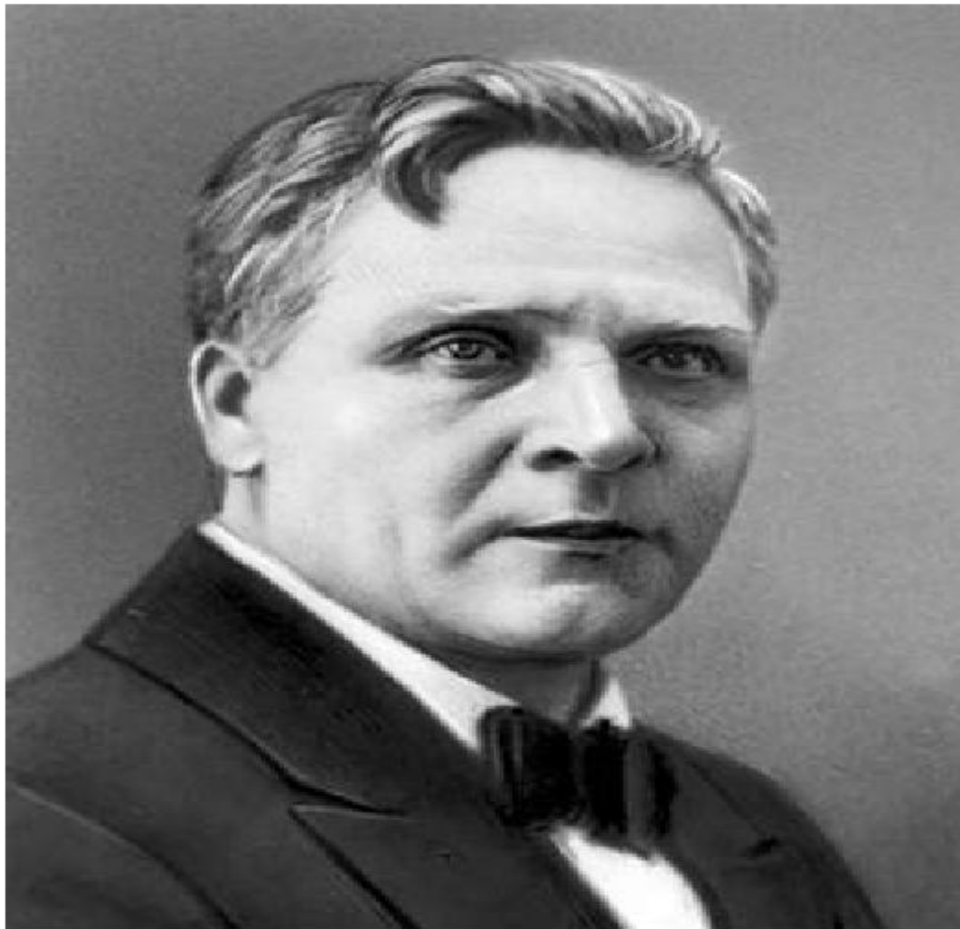
Фёдор Иванович Шаляпин