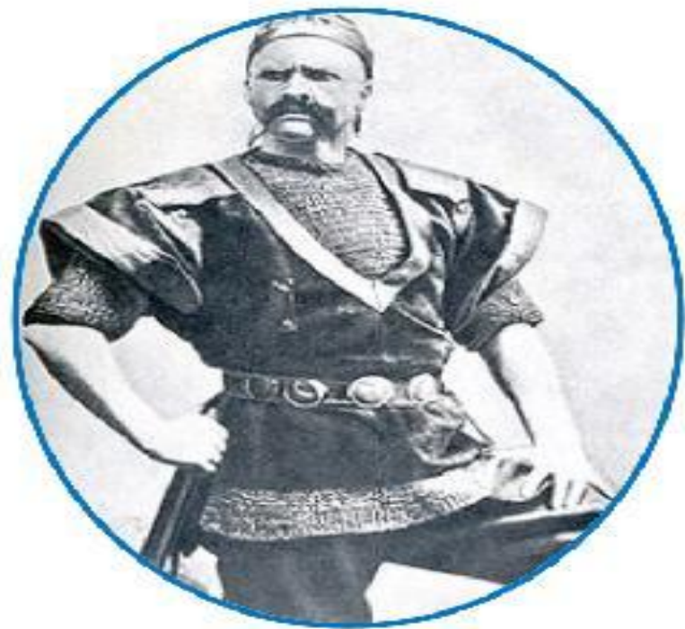
Ф.Шаляпин в роли варяжского гостя.