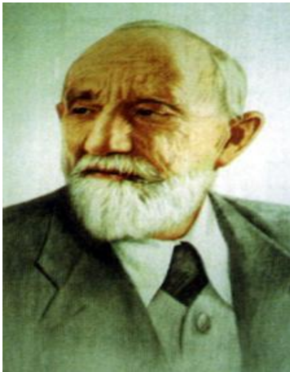
Мичурин Иван Владимирович