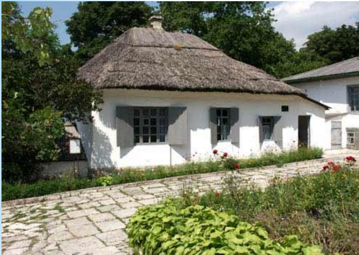
Домик М.Ю. Лермонтова

«Хотя я судьбой на заре моих дней, О южные горы, отторгнут от вас, Чтоб вечно их помнить, там надо быть раз: Как сладкую песню отчизны моей, Люблю я Кавказ.»