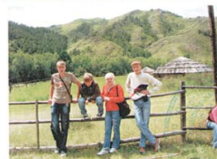
Канон Вериса Владимирская гимназия наш садочек!

Мира». Сегодня мы продолжаем добрые традиции взаимодействия с межрегиональной организацией вместе с Союзом «Дружба – Ынархас», стараемся принимать активное участие в делах и заочных мероприятиях «Дома Мира», привлекать к участию в них лидеров детского движения г. Абакана. Деятельность клуба осуществляется под девизом: «Не в голове, а в сердце лежит начало мира и дружбы» и регламентируется авторской программой детского интернационального движения «Здравствуй, друг!». Очень тесно КМД сотрудничает с клубом интернациональной дружбы «Тад солбоны Хакасской национальной гимназии - интерната им. П. Ф. Катанова». Ребята участвуют в работе