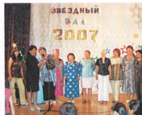
Звездный бал 2007