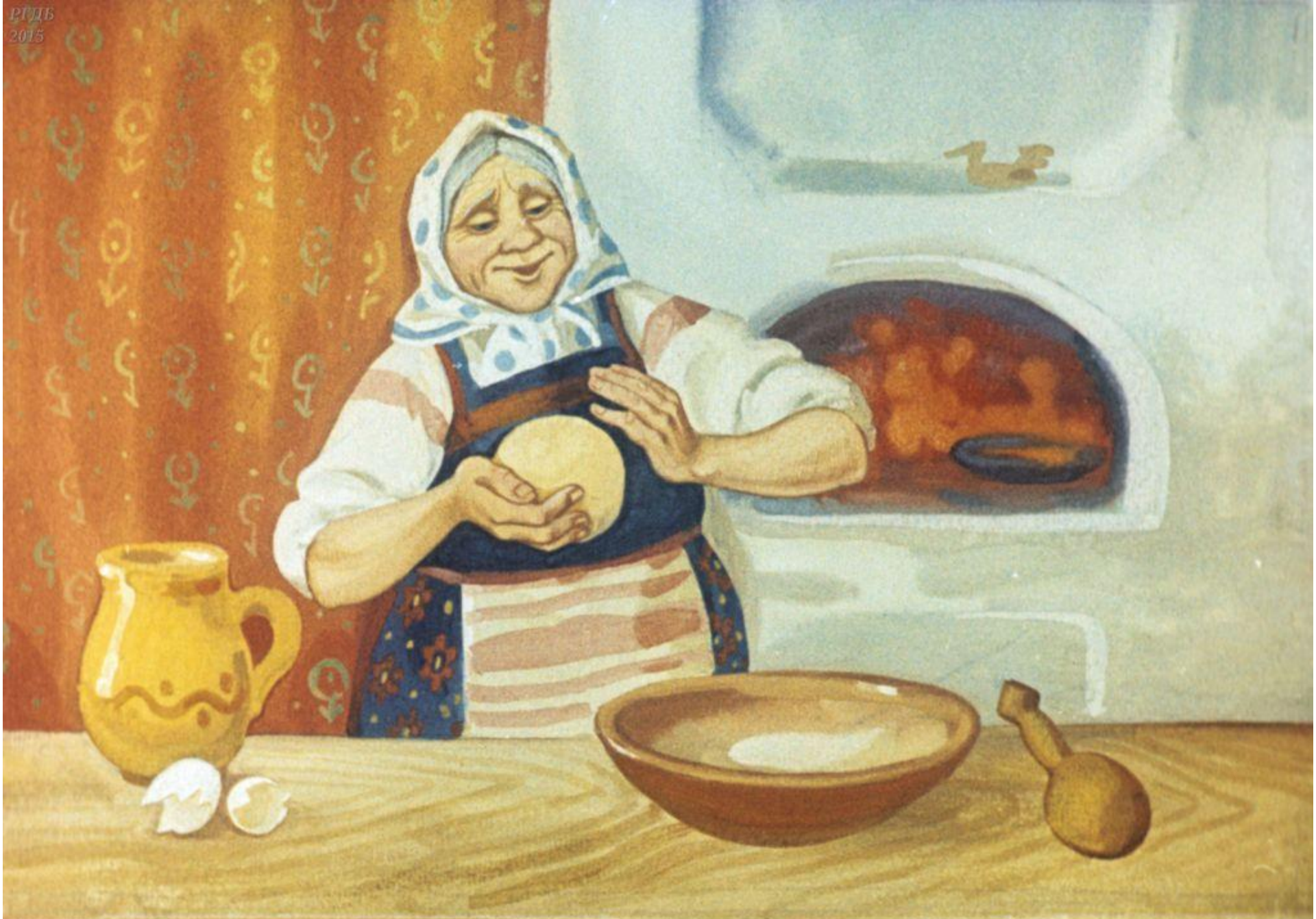
Замесила муку на сметане, состряпала колобок,