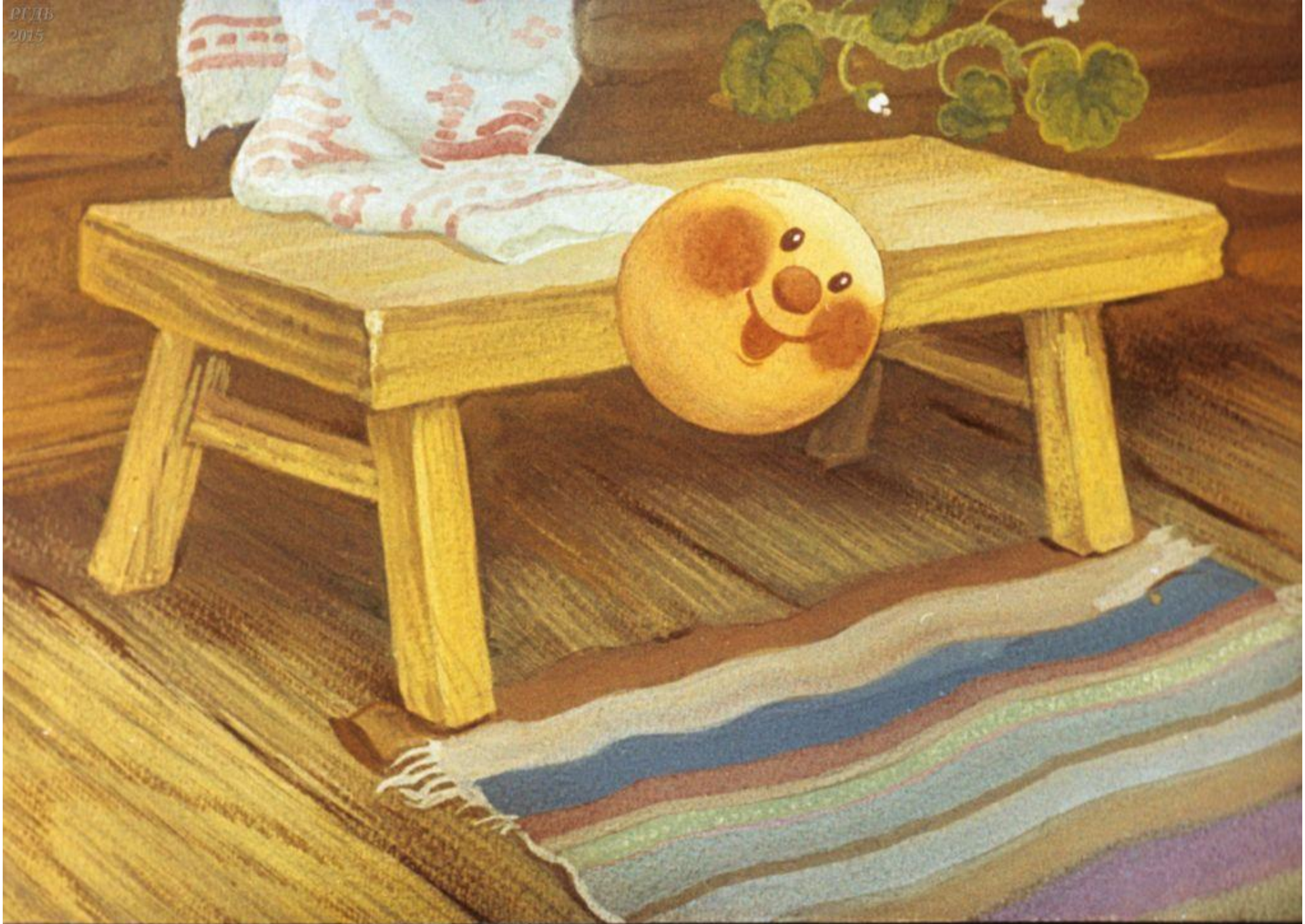
с лавки на пол,