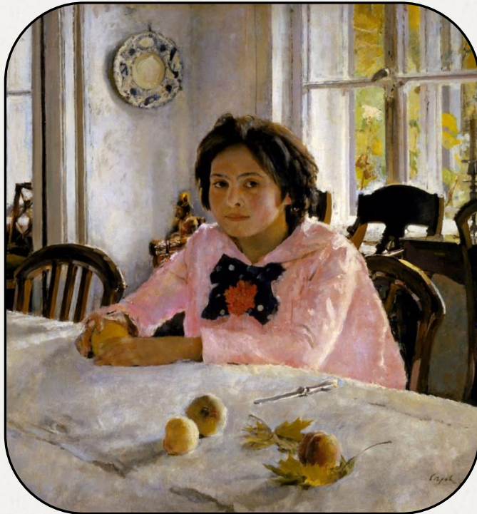
Девочка с персиками