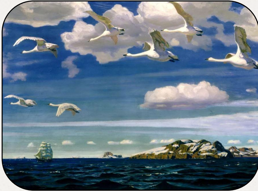
В голубом просторе