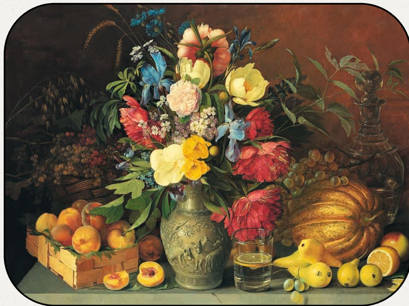
Цветы и плоды