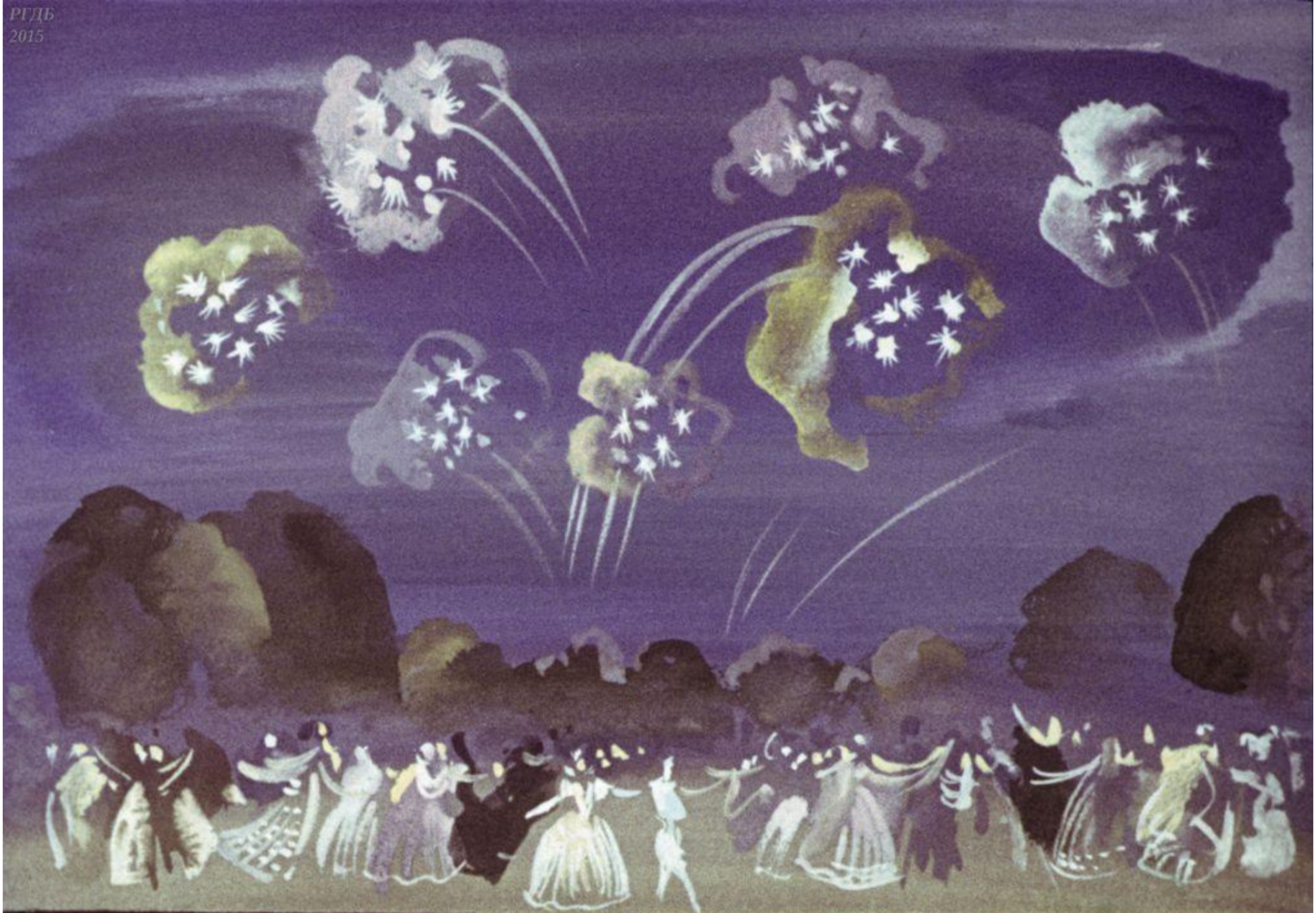
Свадьбу отпраздновали в тот же день.