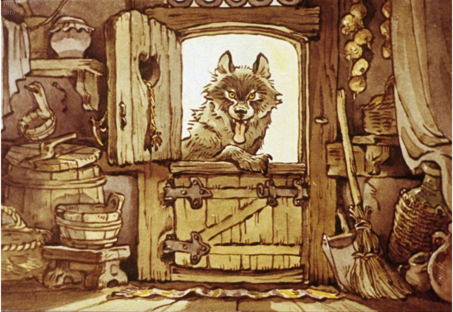
Волк дёрнул за верёвочку—дверь и открылась.