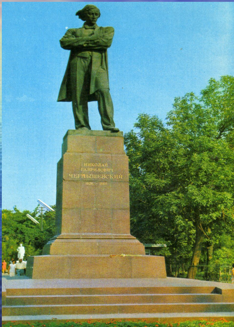
Памятник Н. Г. Чернышевскому