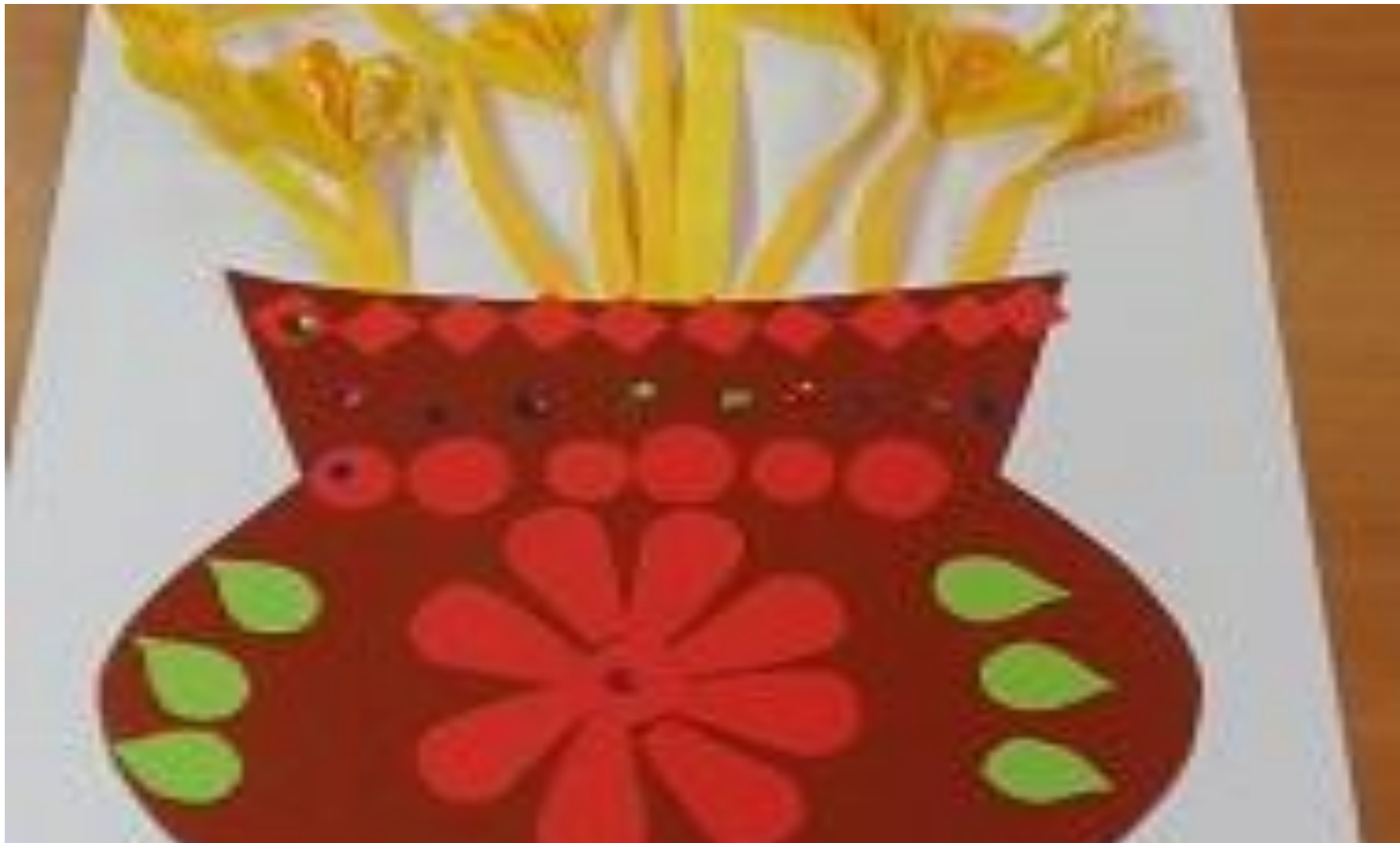
Коллективная работа « Ваза с колосками» с элементами техники квиллинг (старшая группа)