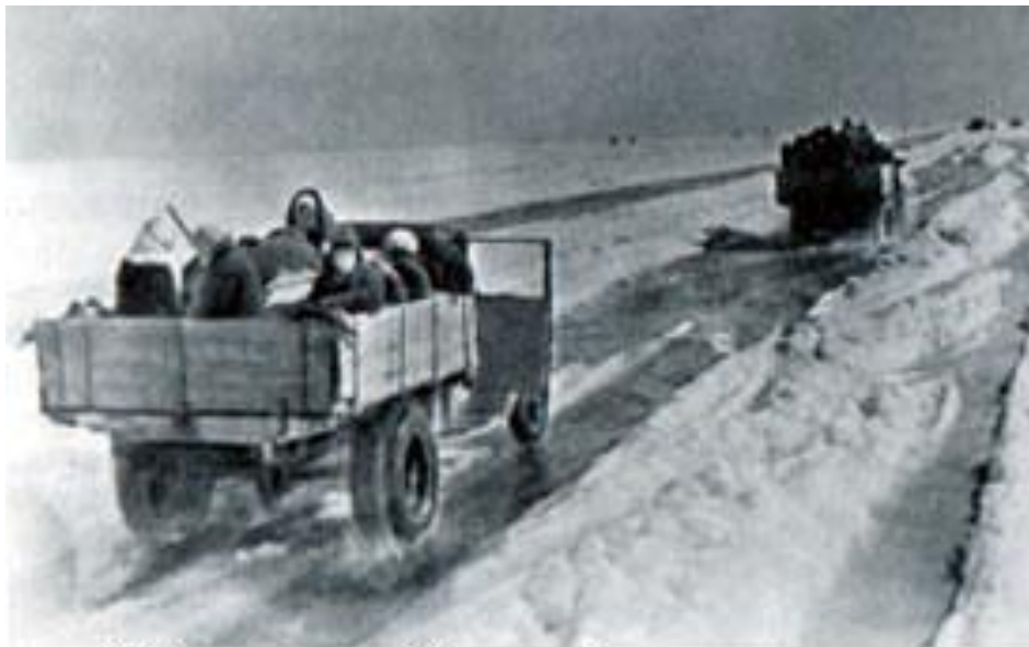
“Дорога жизни” через Ладожское озеро

В первых числах декабря лед окреп и машины ездили не опасаясь провала. Движение грузового автотранспорта не прекращалось практически ни на один день. Было доставлено 16 449 т грузов, что позволило с 25 декабря несколько увеличить хлебный паек.