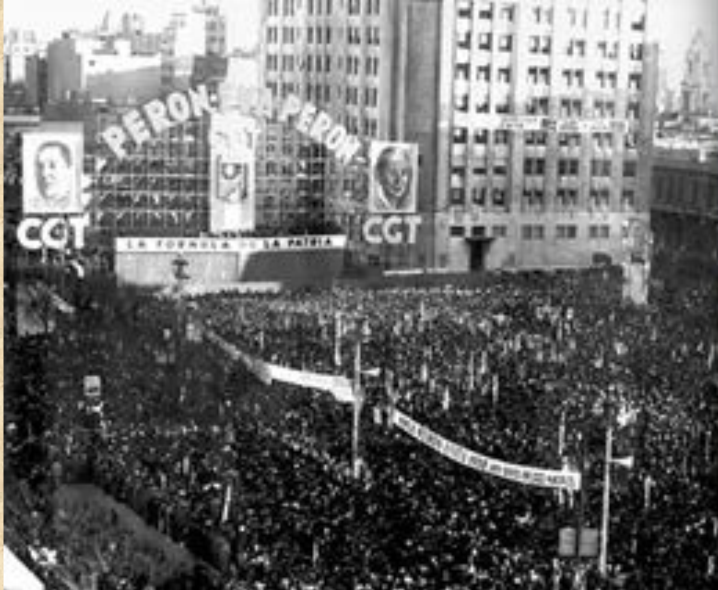
1973- 1974 гг. Митинг в Буэнос-Айресе в поддержку Евы и Хуана Перон.