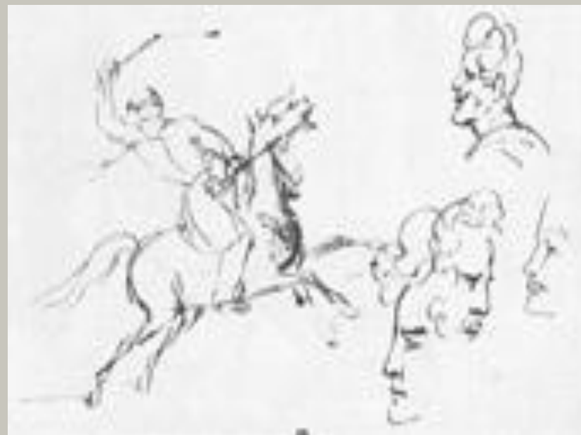
Скачущий всадник и наброски мужских голов.