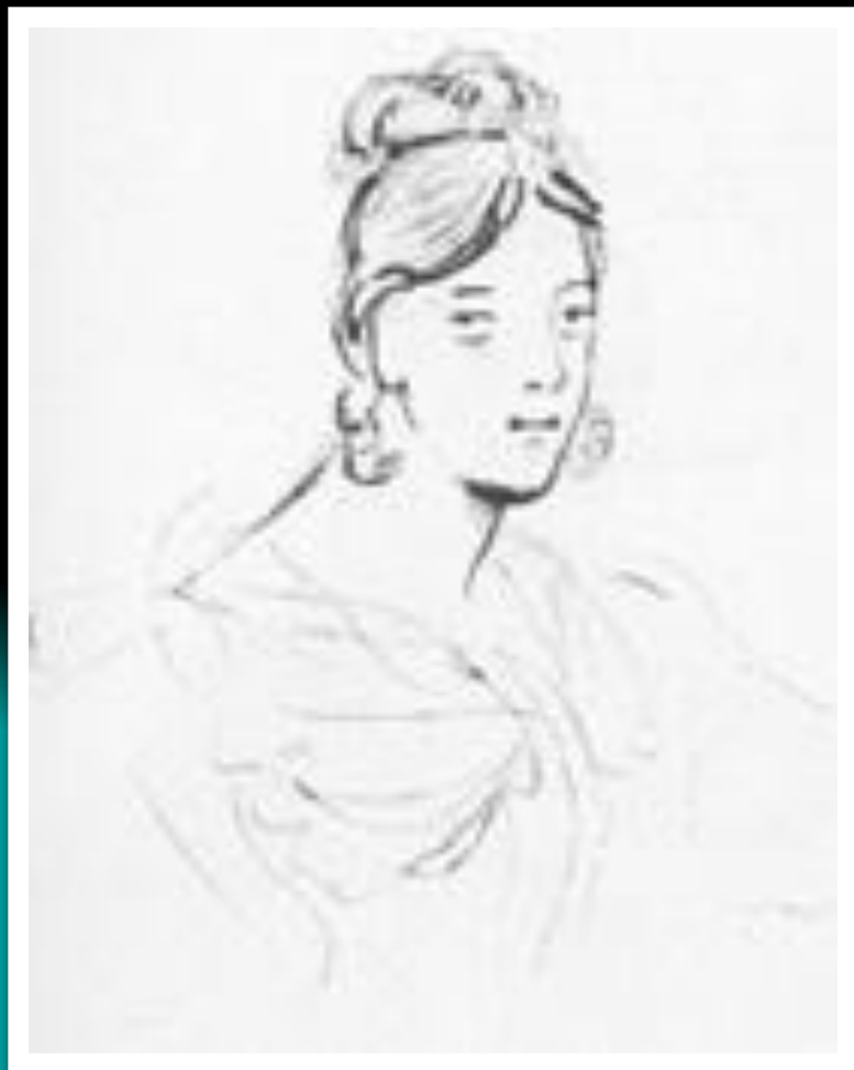
Рисунок М.Ю. Лермонтова. Карандаш. 1832—34