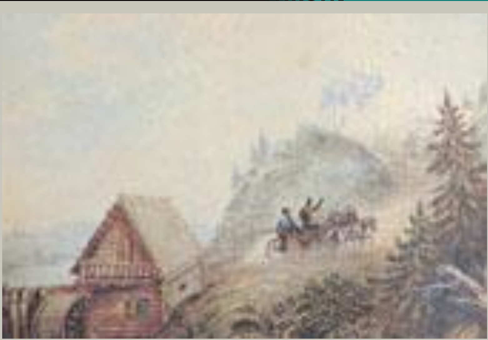
Акварель, 1835 г