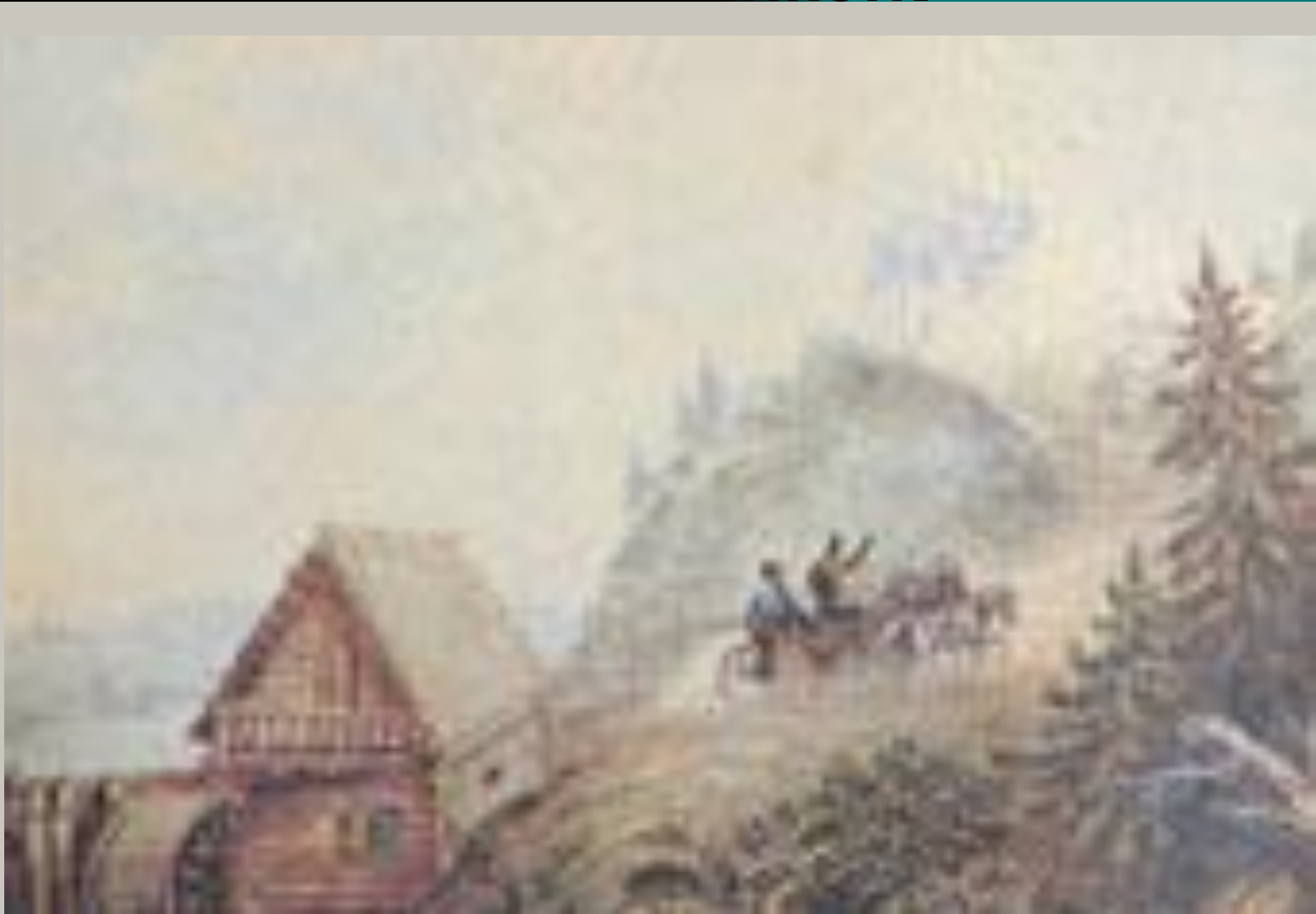
Акварель, 1835 г