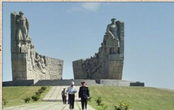
Мемориал Славы на Самбекских высотах