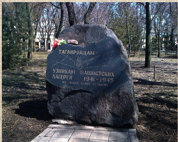
Памятный знак узникам фашистских лагерей