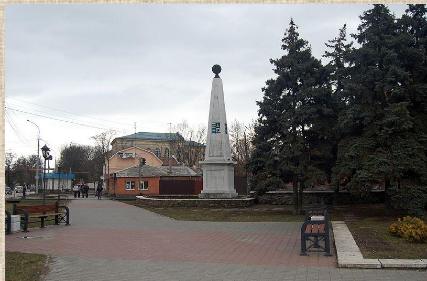
1814 г., 1974 г.