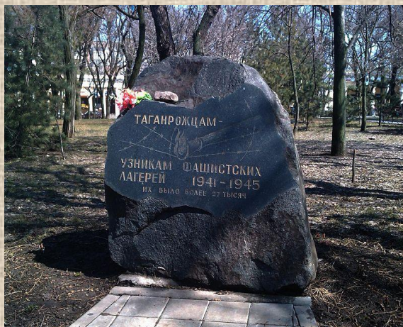
Памятный знак узникам фашистских лагерей