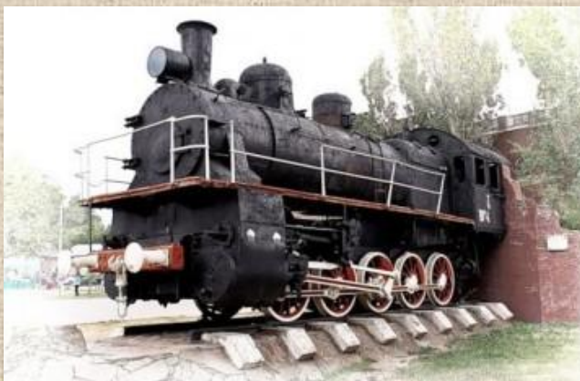
Памятник «Паровоз» серии Щ