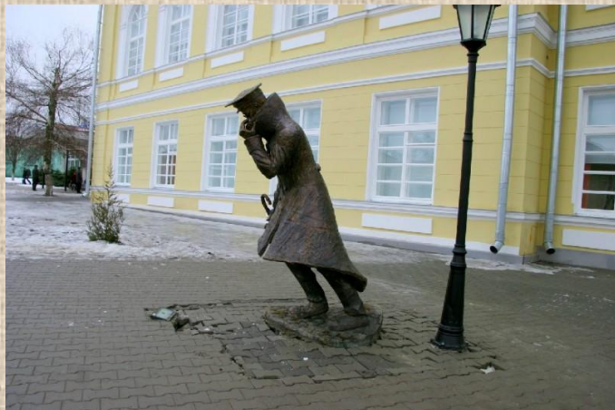
«Человек в футляре»