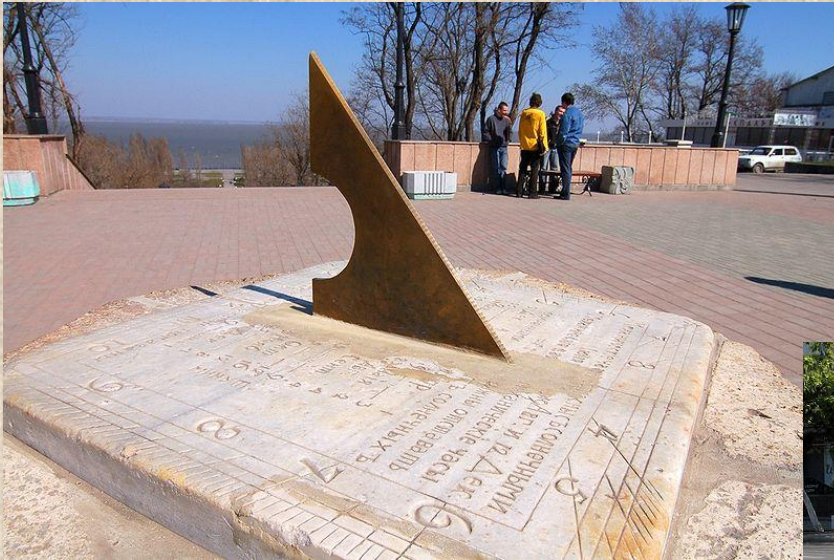
Новые солнечные часы 2000г.