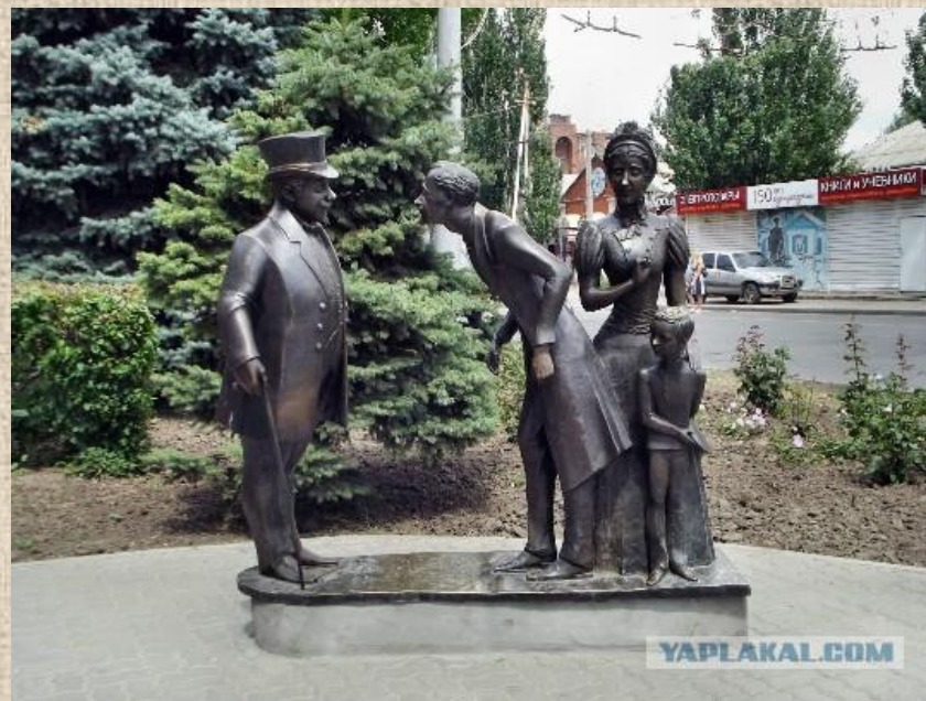
«Толстый и Тонкий»