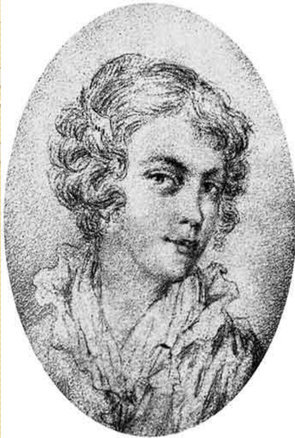
М.Протасова Рисунок карандашом В.А. Жуковского. 1811 г.

«Были они разные, и по внешности, и по характерам,— писал замечательный биограф Жуковского писатель Б. К. Зайцев.— Старшую, Машу, изображения показывают миловидной и нежной, с не совсем правильным лицом, в мелких локонах, с большими глазами, слегка вздернутым носиком, тонкой шеей, выходящей из романтически-мягкого одеяния,— нечто лилейное. Она тиха и послушна, очень религиозна, очень склонна к малым мира сего — бедным, больным, убогим. Русский скромный цветок, кашка полей российских. Александра другая. Это — жизнь, резвость, легкий полет, гений движения. Собою красивее, веселее и открытой сестры, шаловливей».