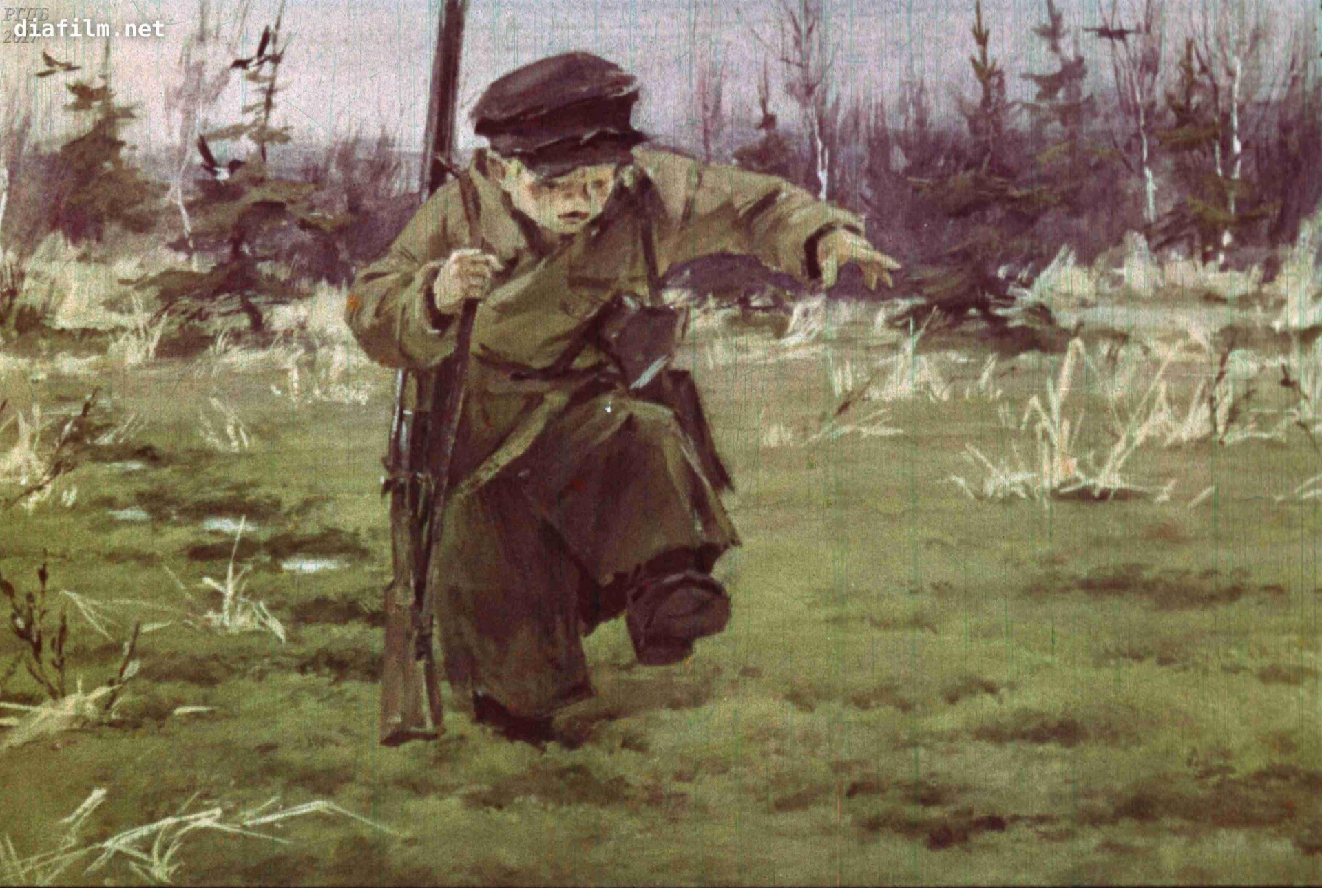
Ноги Митраши всё глубже утопали, всё труднее их было вытаскивать.