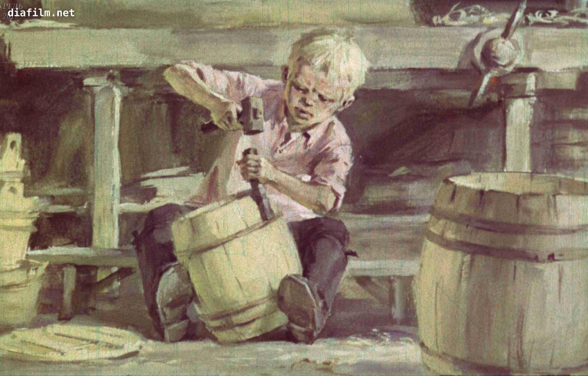
Митраша выучился у отца делать деревянную посуду: бочонки, шайки, лоханки. Он сделает для соседей бочонок или надушечку, а они ему тоже отплатят добром.