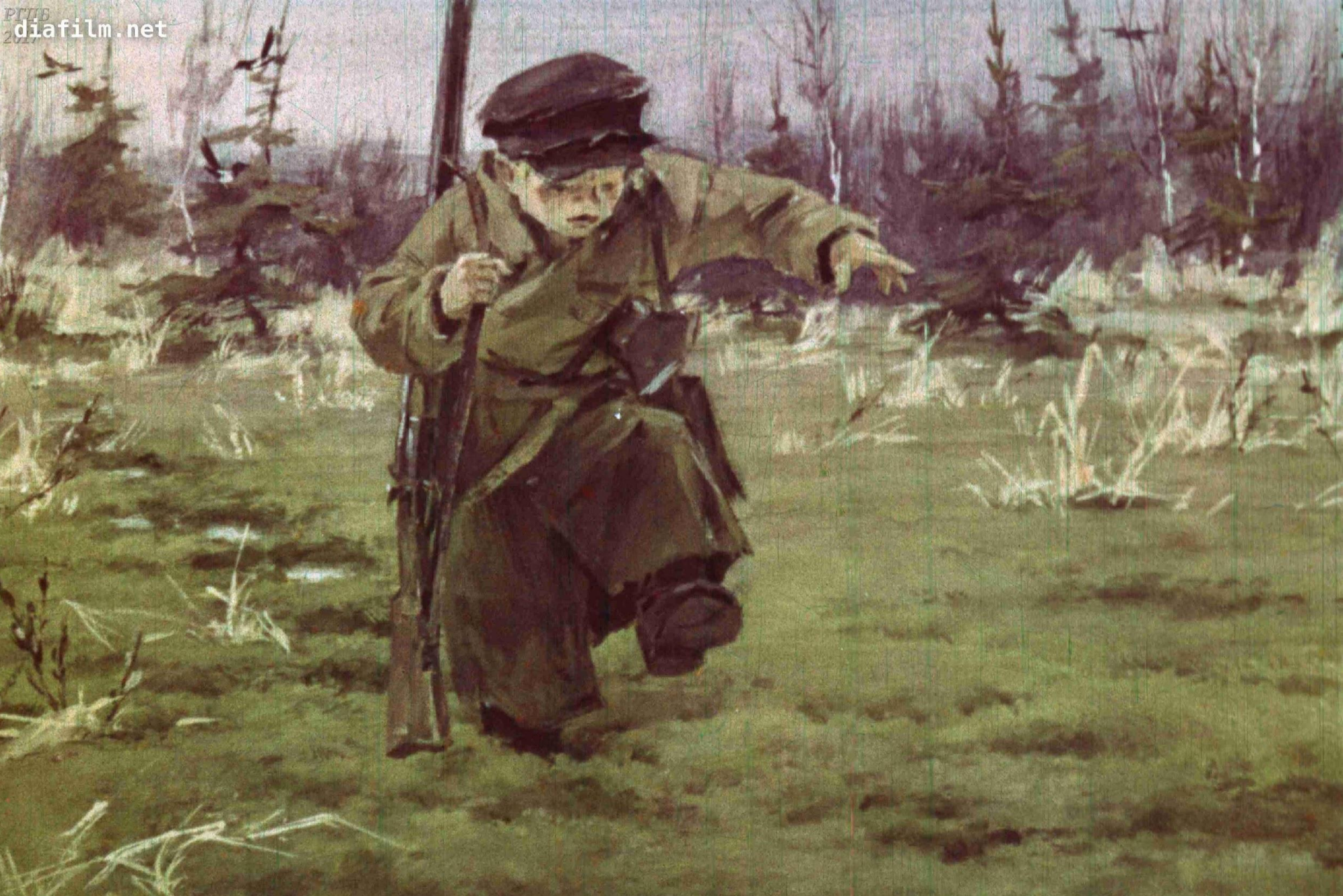
Ноги Митраши всё глубже утопали, всё труднее их было вытаскивать.