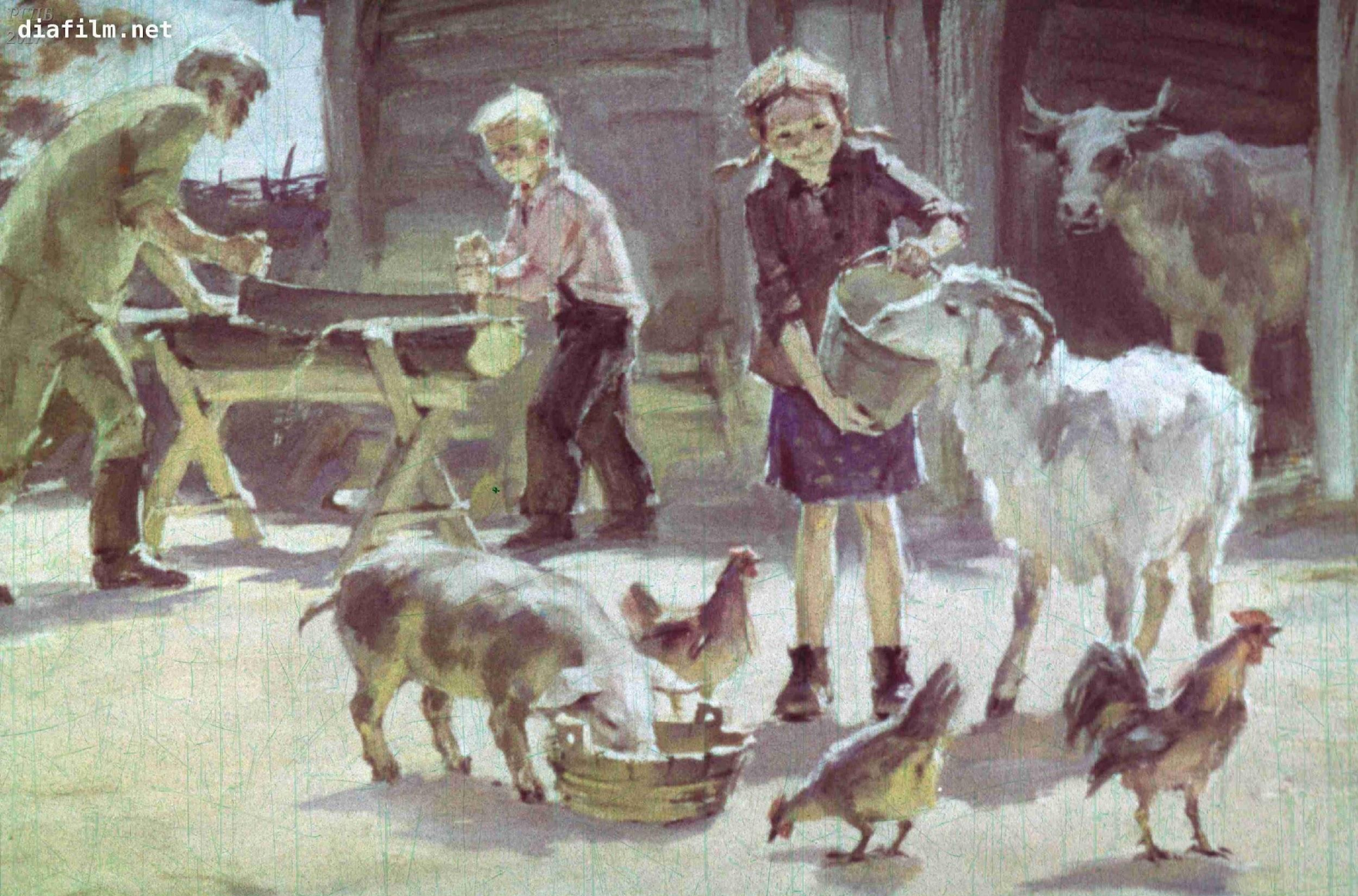
Все соседи помогли детишкам, а скоро умные дружные ребята сами научились управляться с хозяйством.