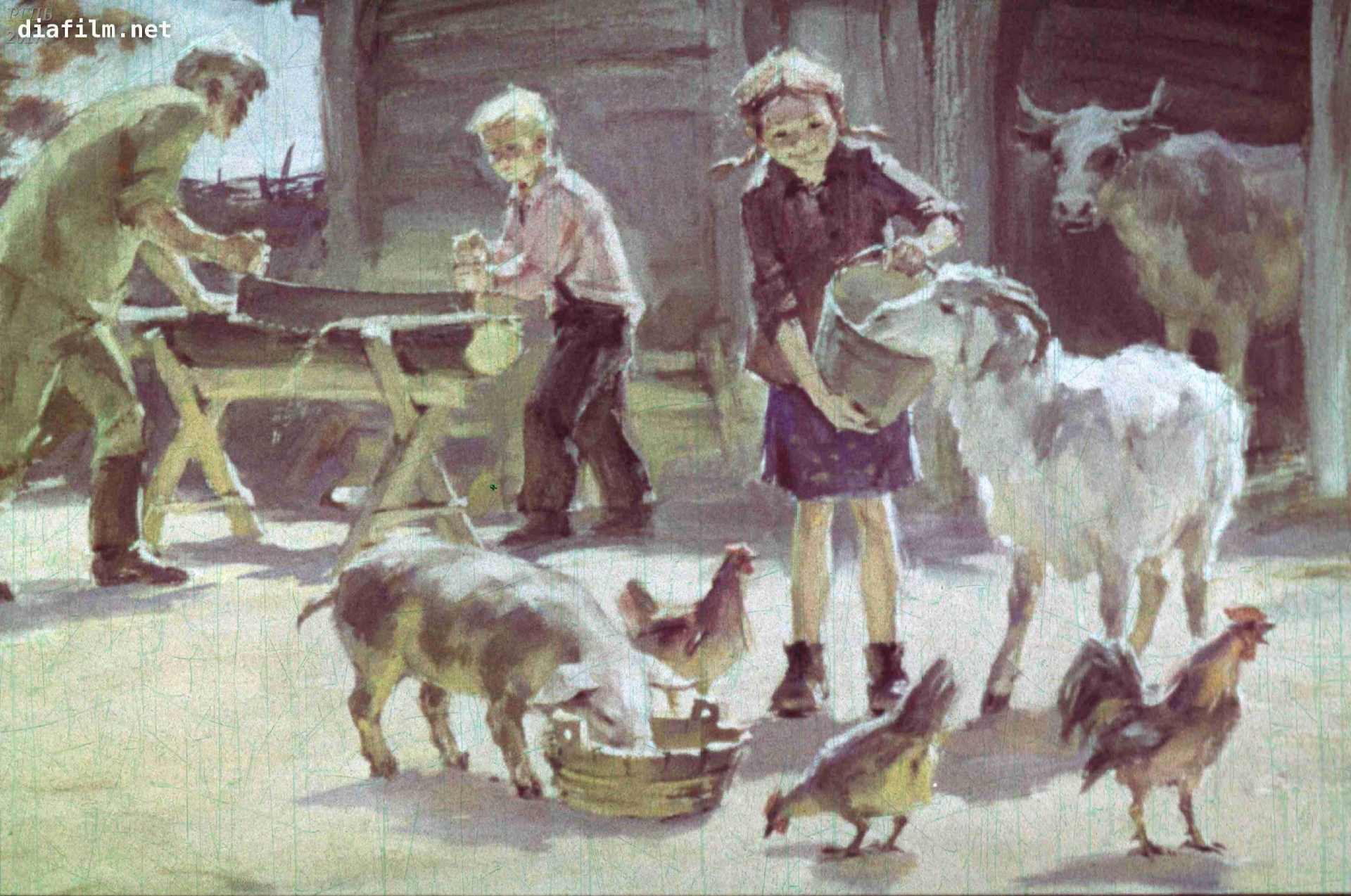
Все соседи помогли детишкам, а скоро умные дружные ребята сами научились управляться с хозяйством.