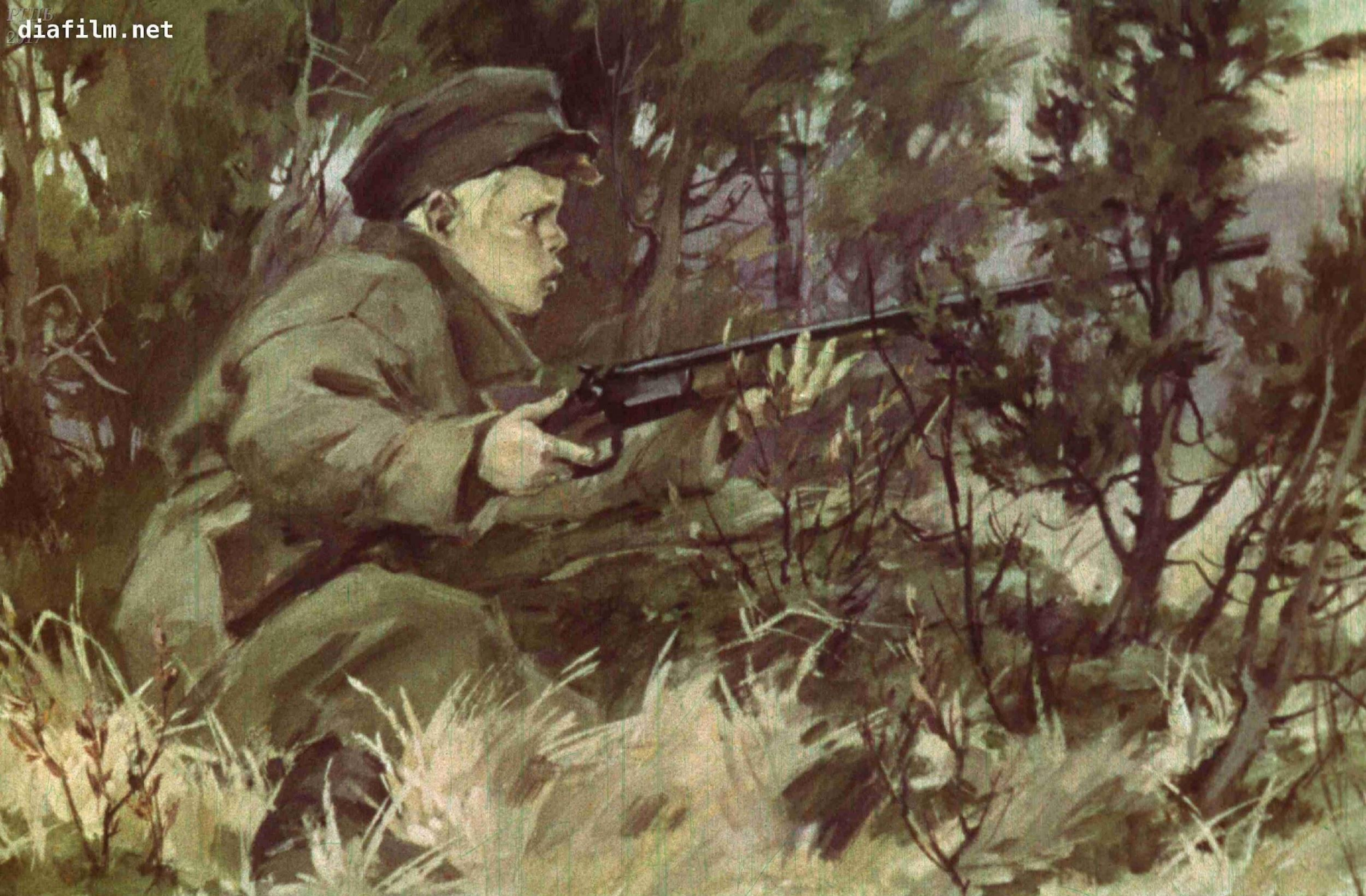
Голодный Митраша, еле живой, надеясь убить зайца, переменял подмокшие патроны и притаился в кусту можжевельника.