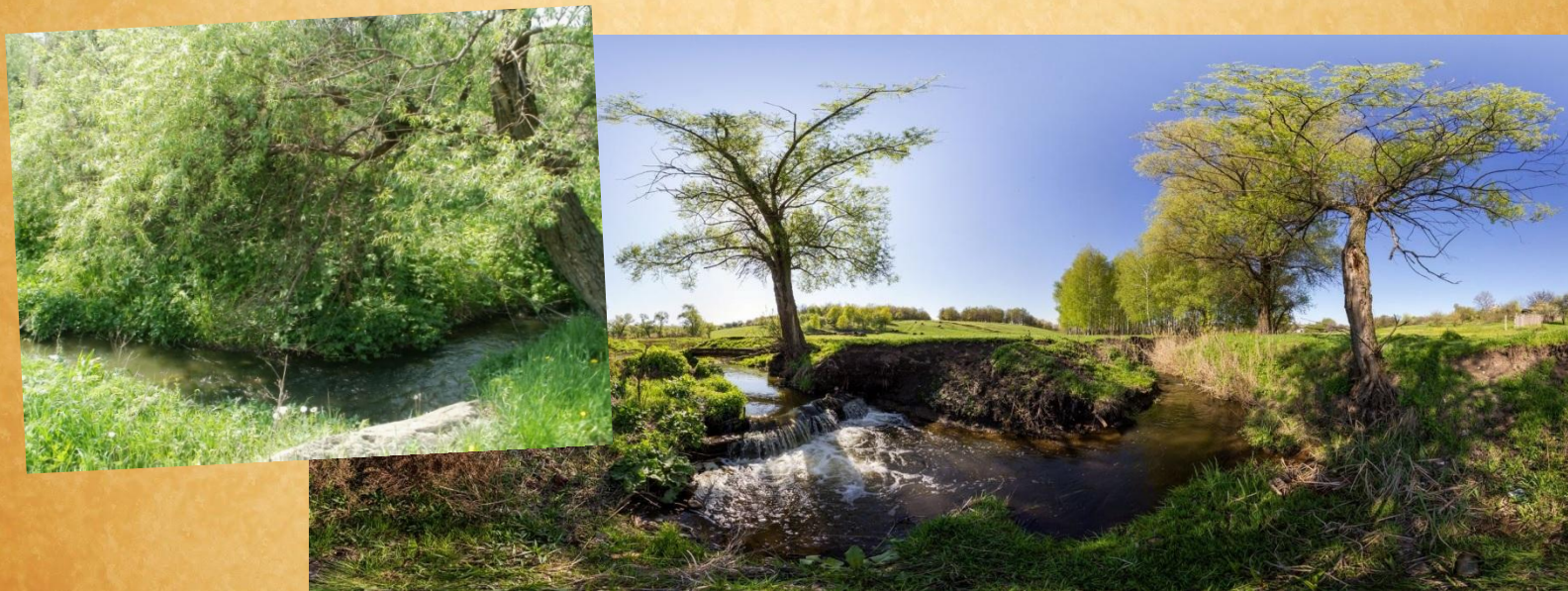
Река Лугань и река Корсунь