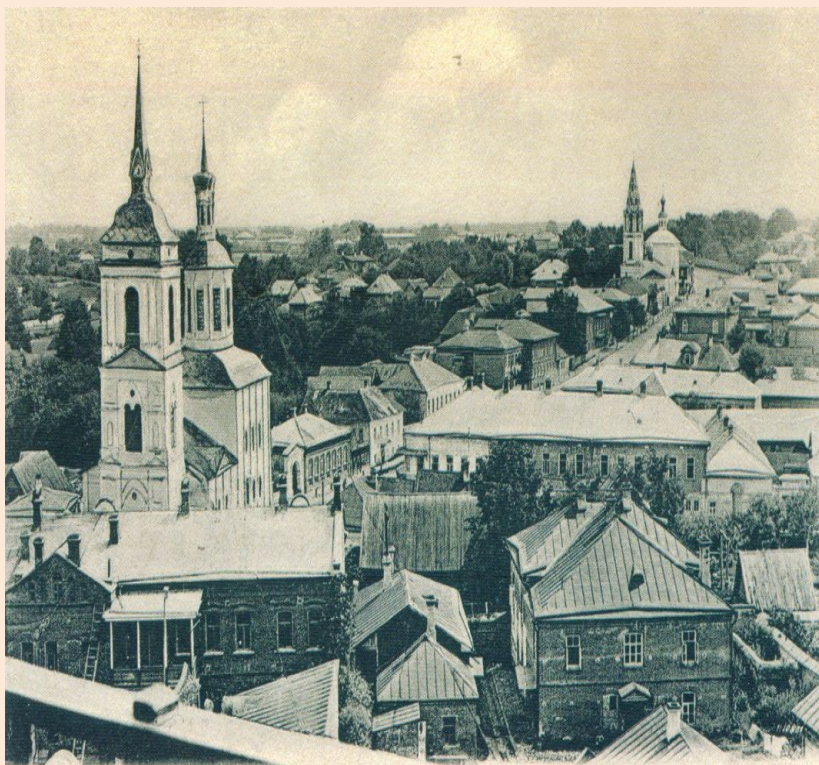
Вязьма. Московская ул., Никитская и Пятницкая церкви.

БЕСЕДУЕМ ПО ТЕМЕ: «ВЯЗЬМА В ГОДЫ ВЕЛИКОЙ ОТЕЧЕСТВЕННОЙ ВОЙНЫ»