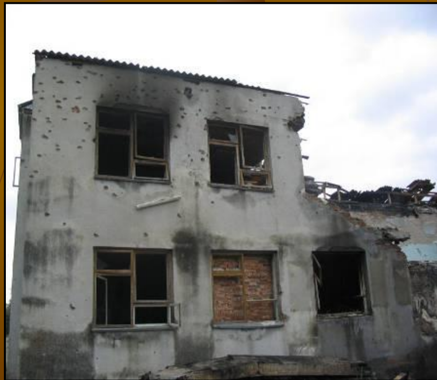
Школа, разрушенная в ходе теракта.