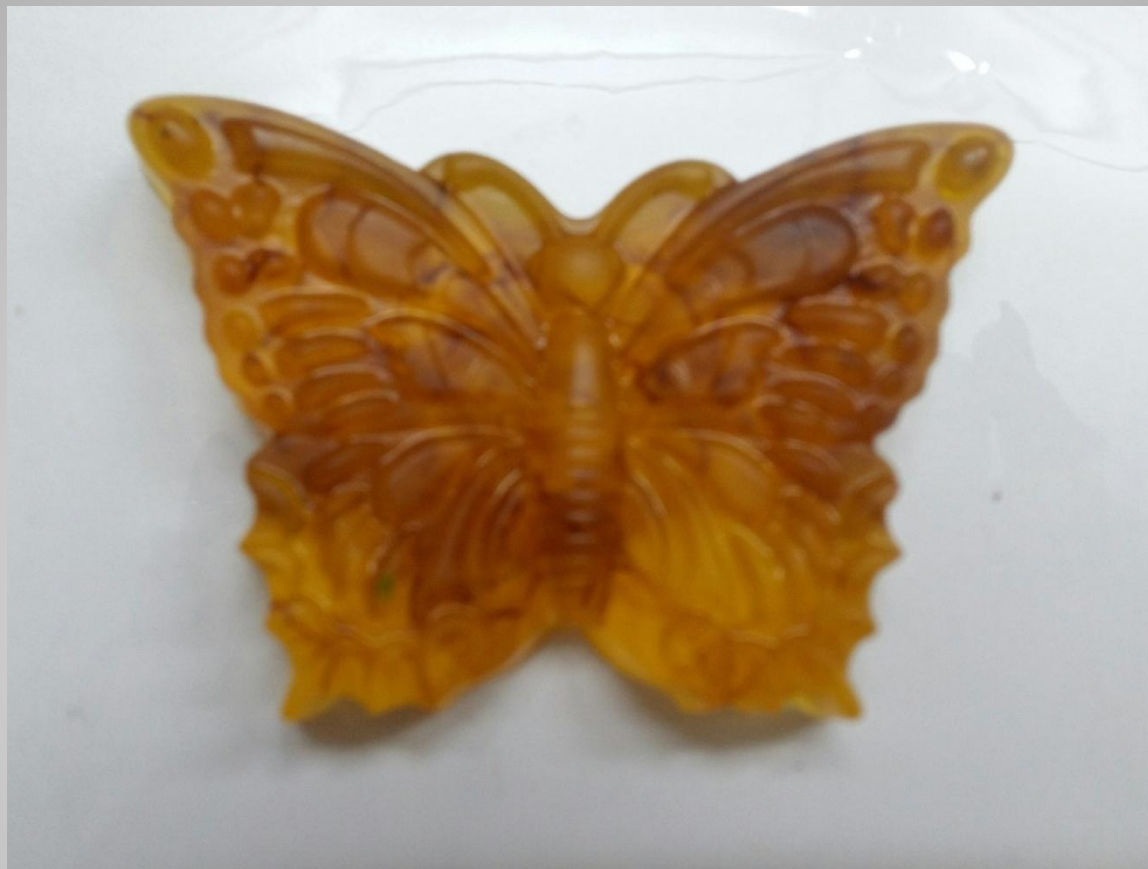
Мыло с цветками календулы.