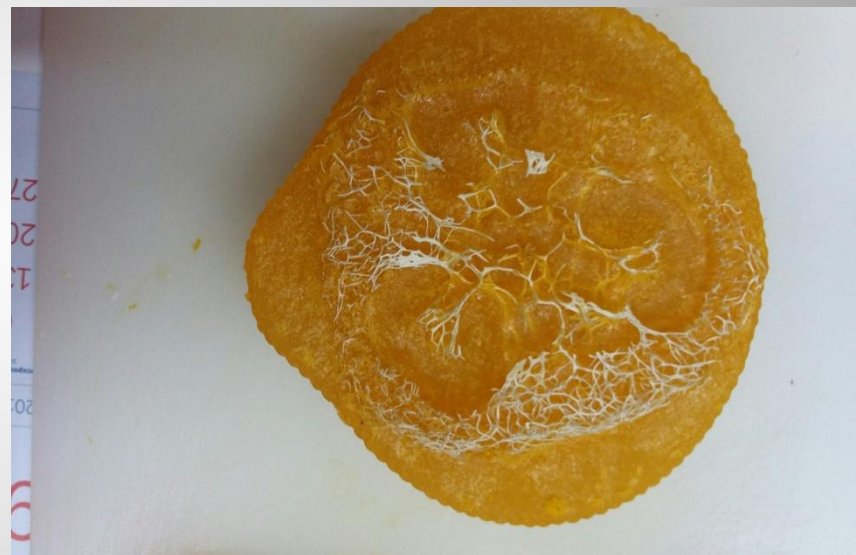
Мыло-скраб с люфой