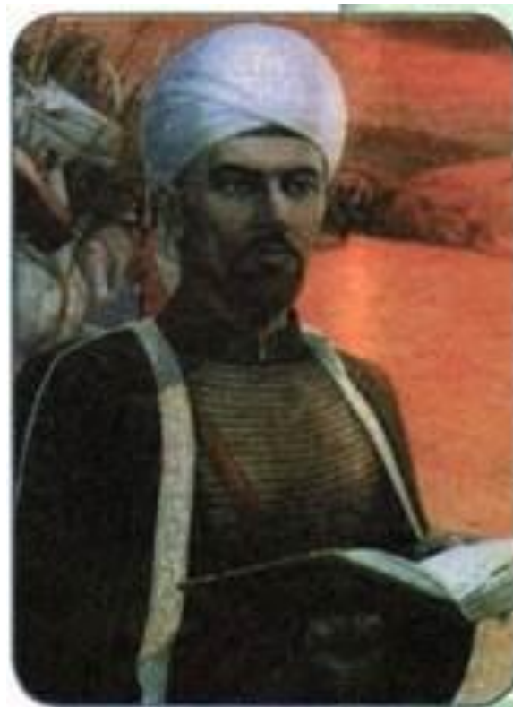
мулла Абдулла Галеев (Батырша)