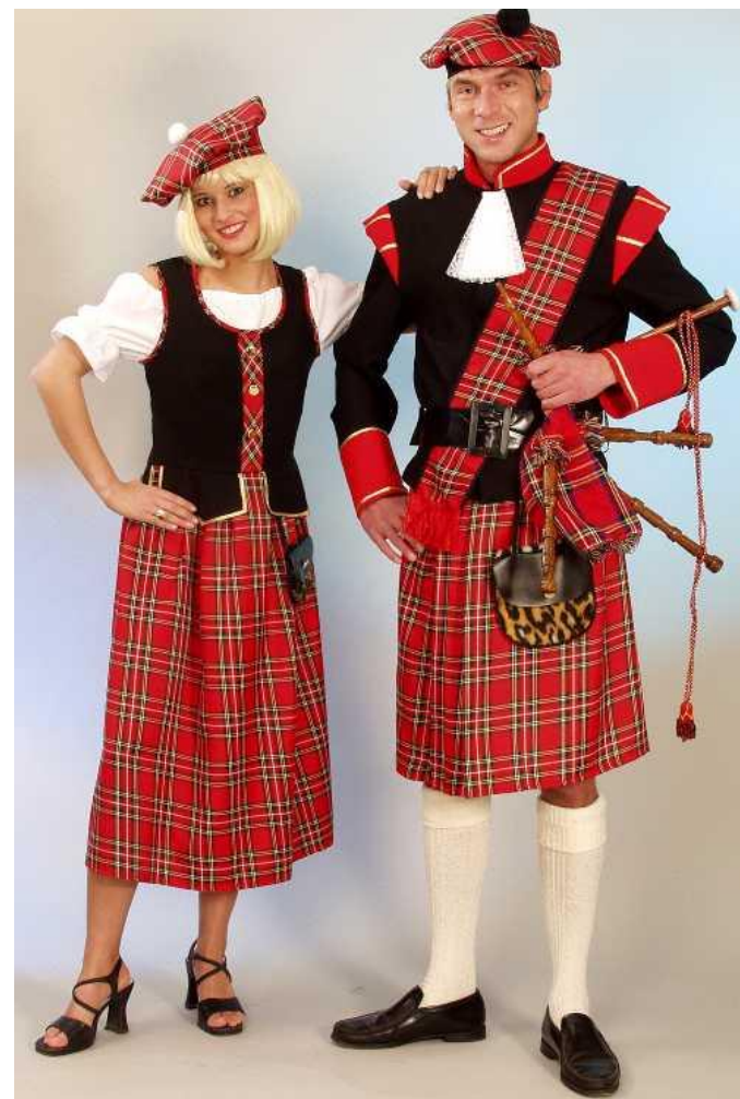
клетчатый килт, если речь идет о Шотландии