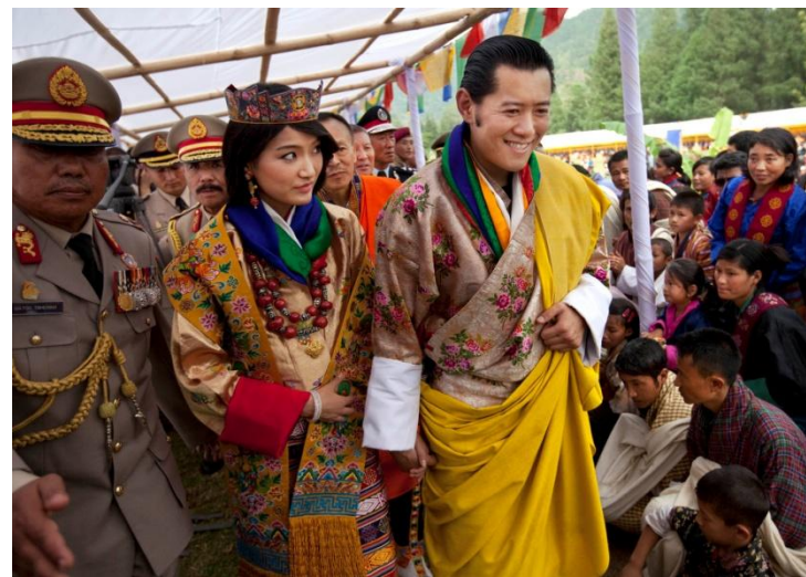
король и королева Бутана

Бутан — это единственная страна в мире, где местное население обязано носить национальную одежду. Национальный костюм носят все, без него не пустят ни в одно государственное учреждение или другое приличное место, это нарушение общественного этикета.