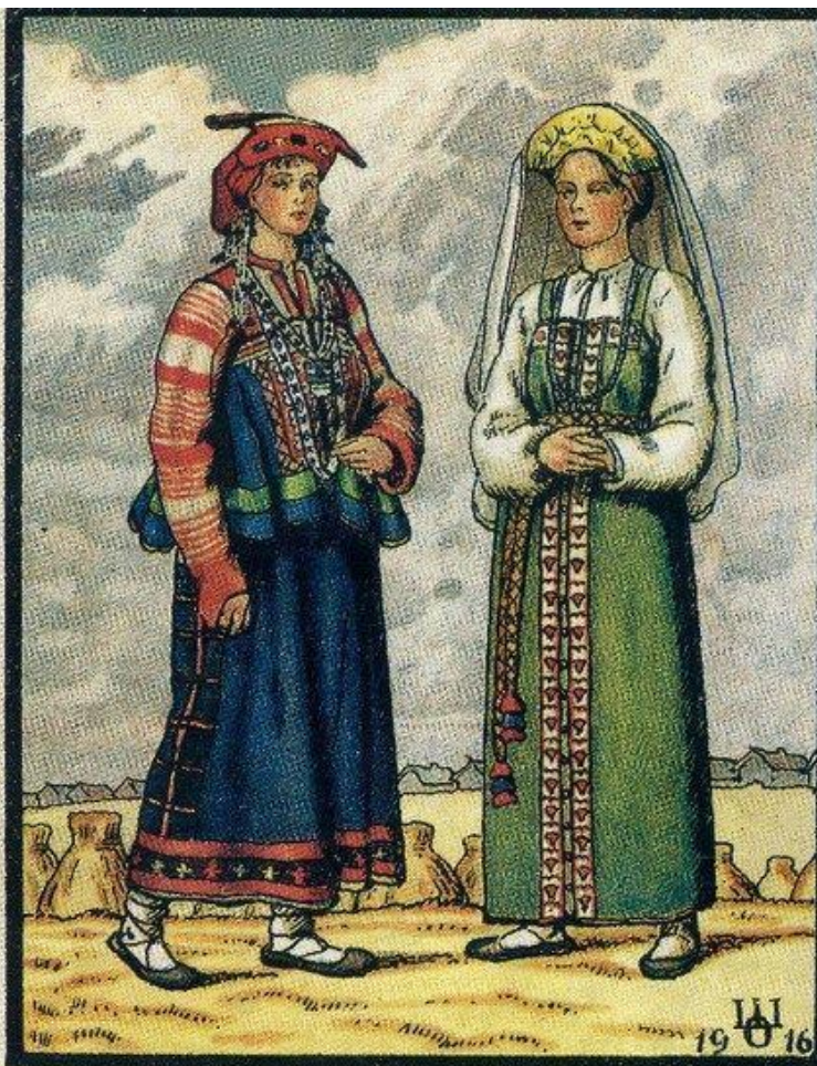
Народная женская одежда. 1. ВЕЛИКОРОССЫ 2. Рязанской и Пензенской губерний.