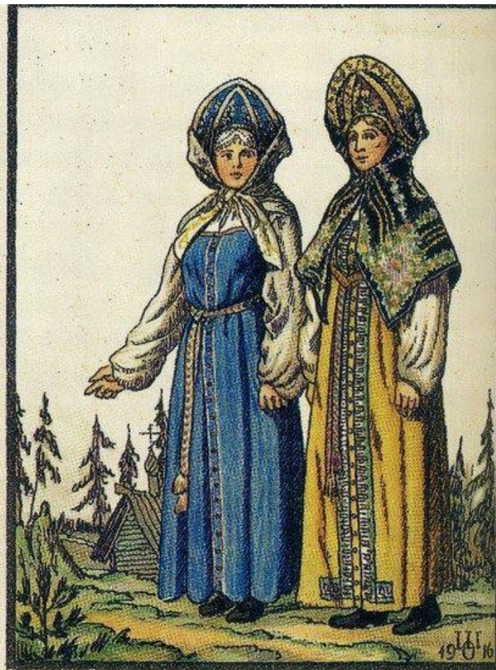
Народная женская одежда. ВЕЛИКОРОССЫ Шамбовской и Воронежской губерний.