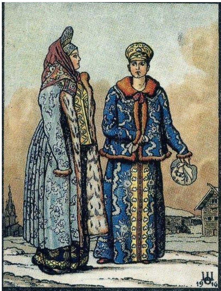
Народная женская одежда. ВЕЛИКОРОССЫ Архангельской и Вологодской губерний.