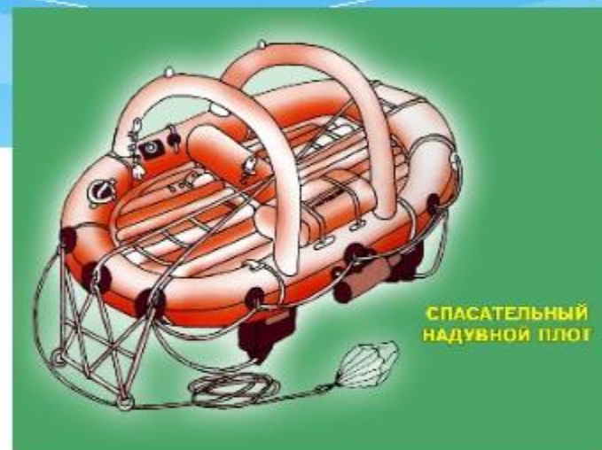
СПАСАТЕЛЬНЫЙ НАДУВНОЙ ПЛОТ