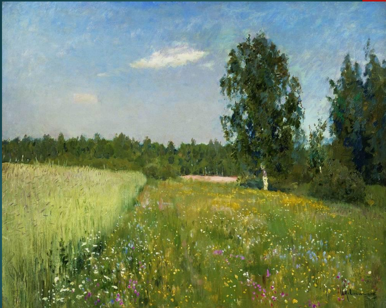
ИСААК ИЛЬИЧ ЛЕВИТАН