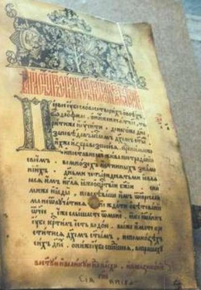
Иларион. «Слово о Законе и Благодати»