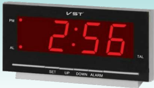
VST 778T-1 Size: 180x60x95mm