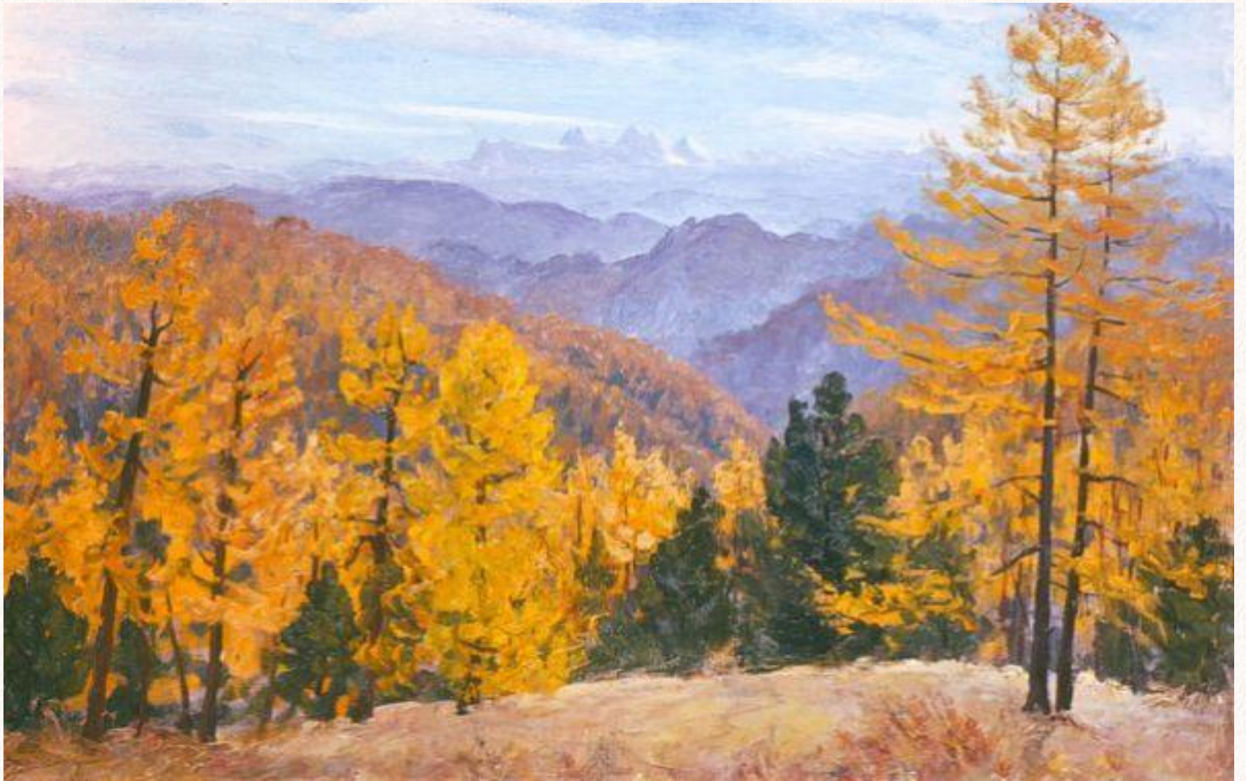
А.П. Щетинин. «Осень на Алтае. Белуха»