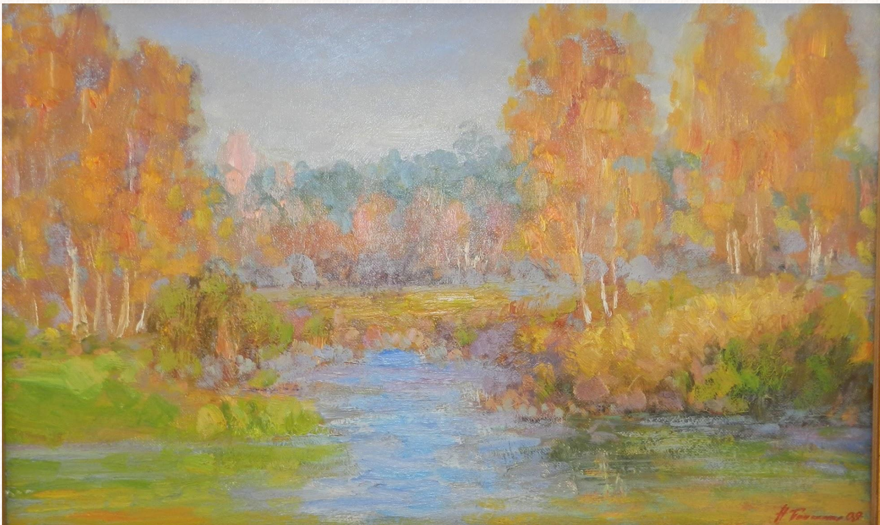
Н.В. Панченко «Кулунда осенью» Холст. Масло, 2009