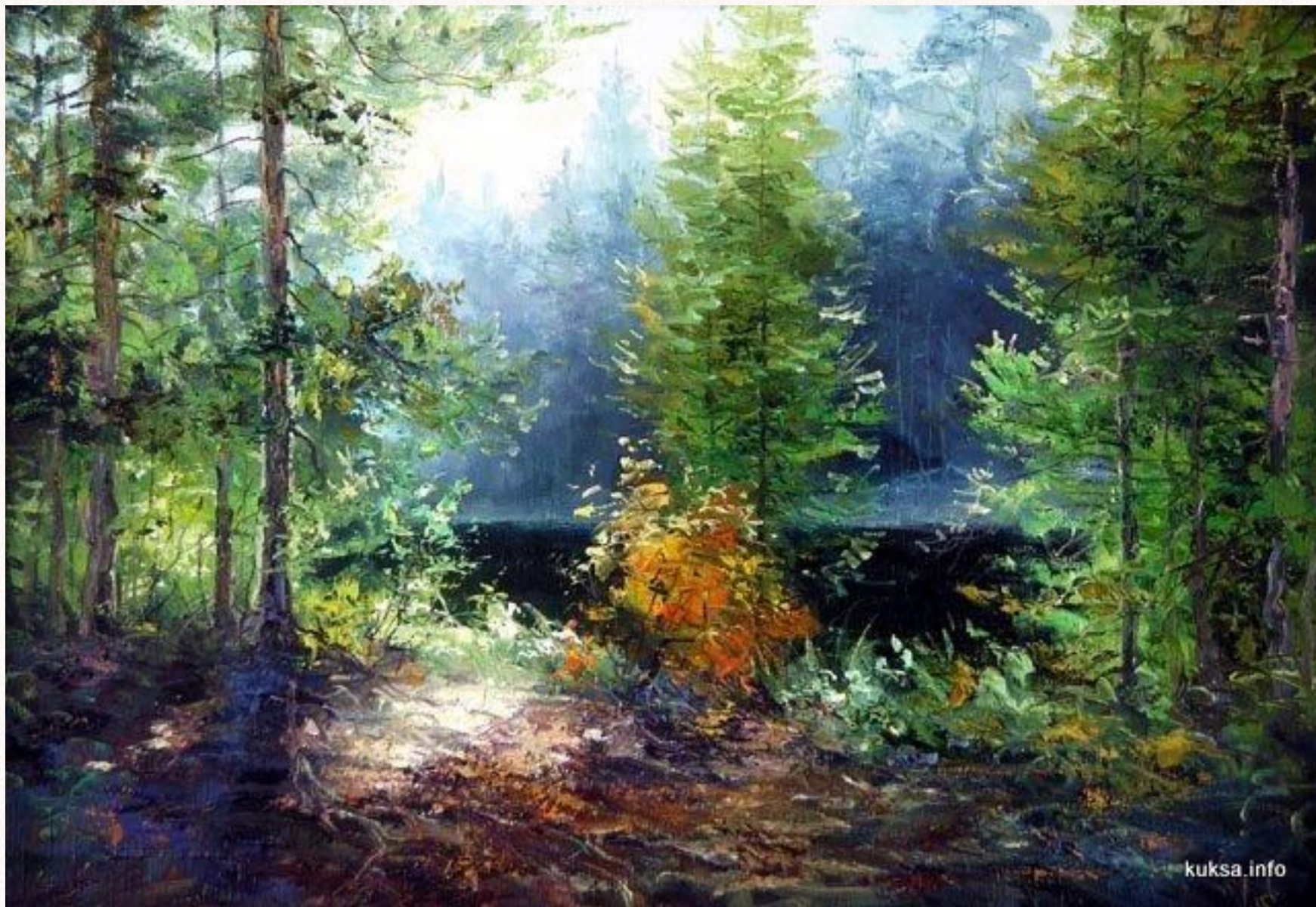
В.П.Кукса. Холст. Масло