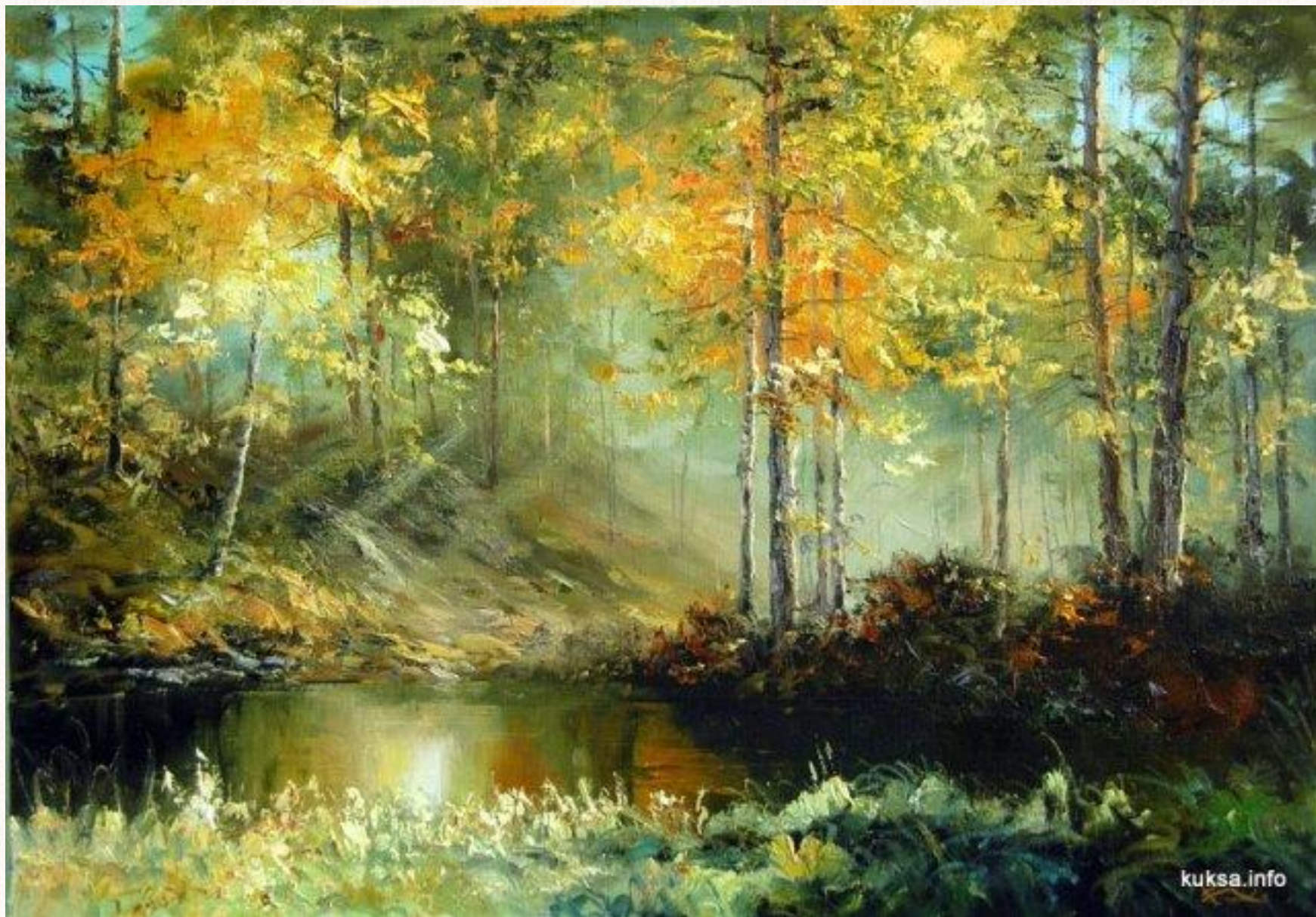
В.П.Кукса. «Осенью у пруда» Холст. Масло