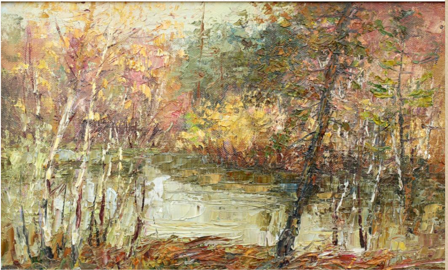
Н.В. Панченко. Холст. Масло