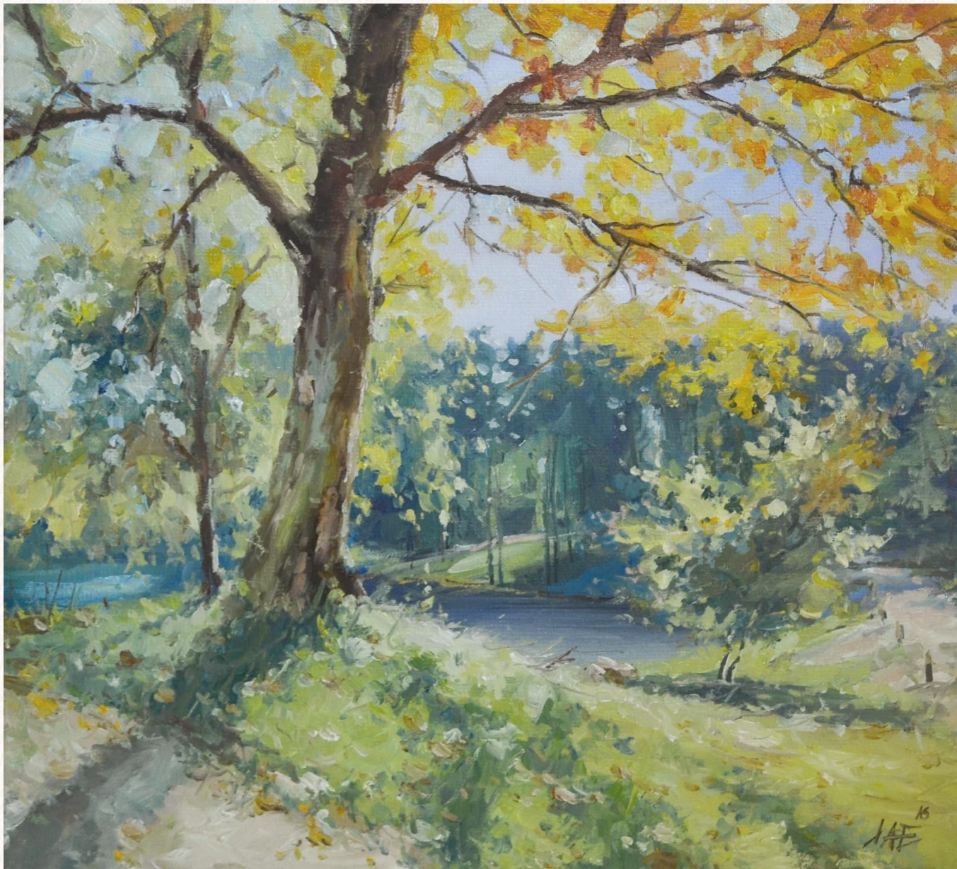
А.Ложкин «Бабуье лето» холст. Масло. 2016