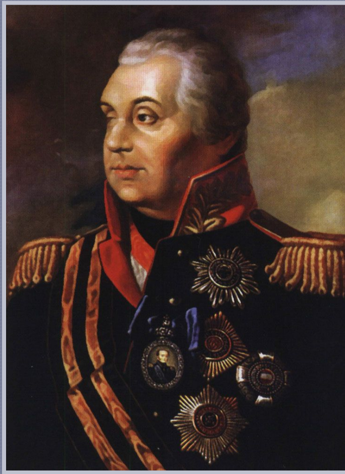
Михаил Илларионович Кутузов