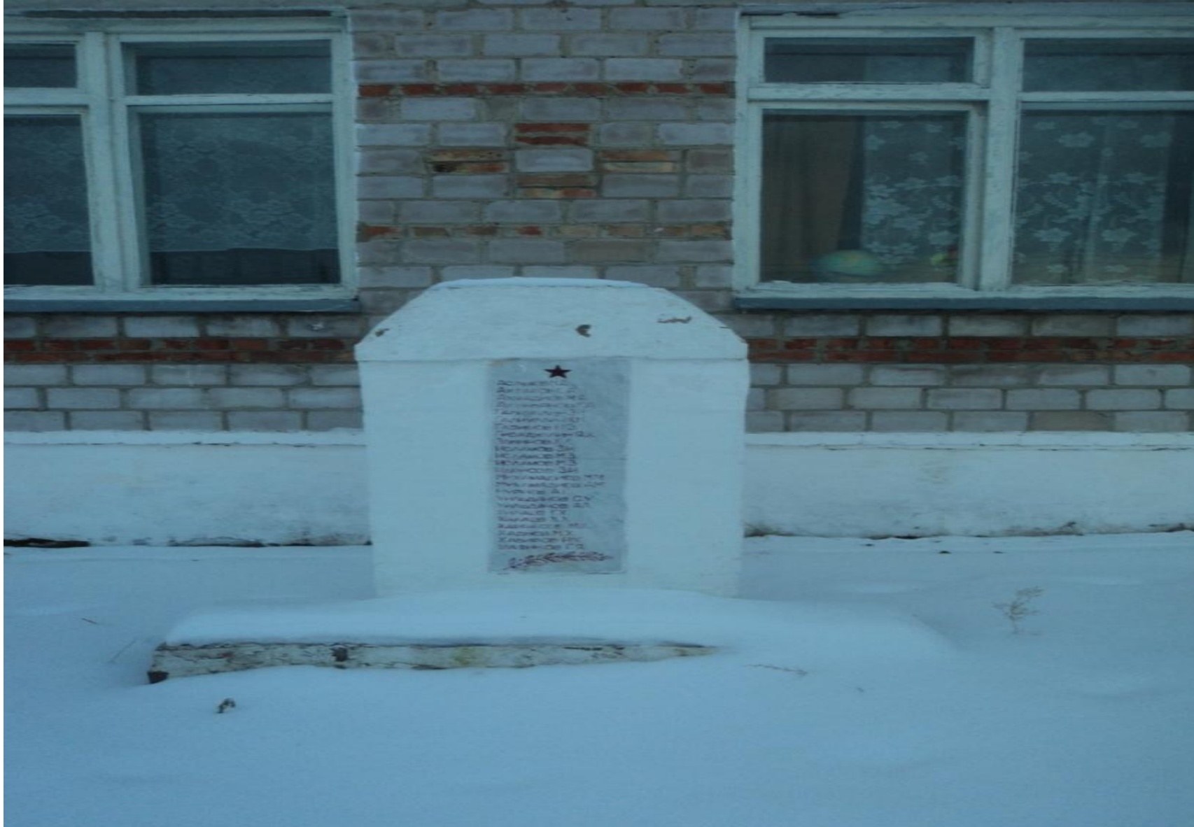
Кусепеево Год ввода: 1996 г