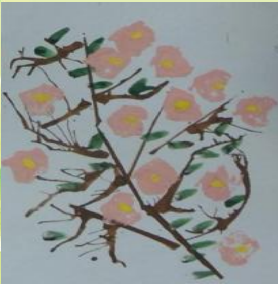
Агафонов Д 5 лет