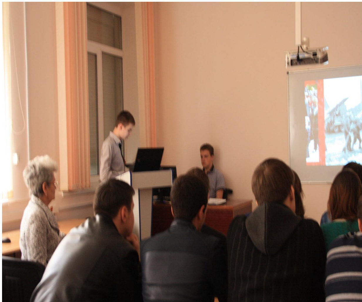
Работа секции №5 - « Партизанское движение на Ставрополье»