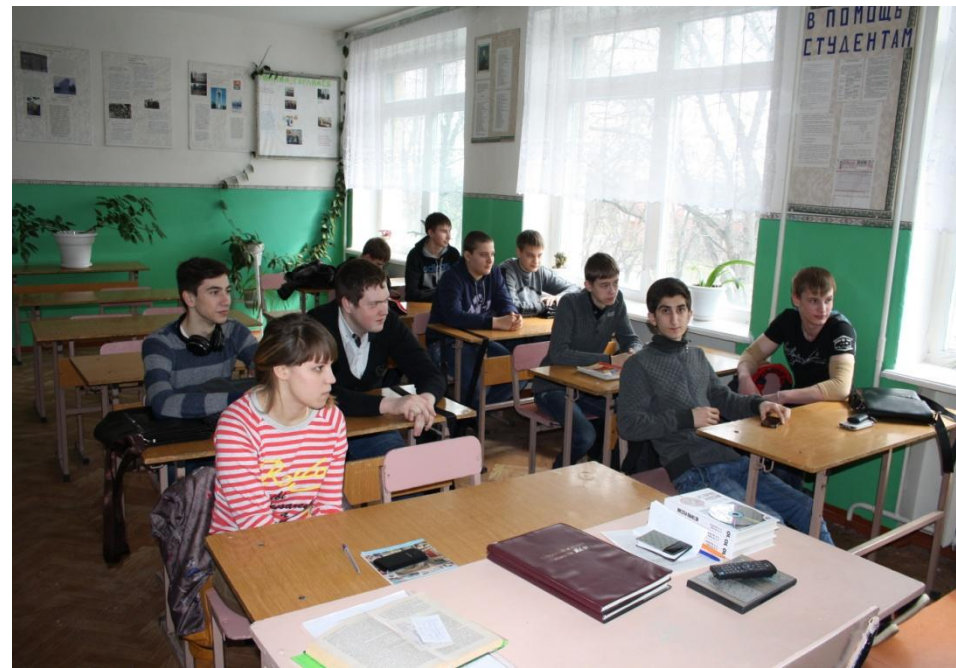
Просмотр документального фильма « Блокада Ленинграда»