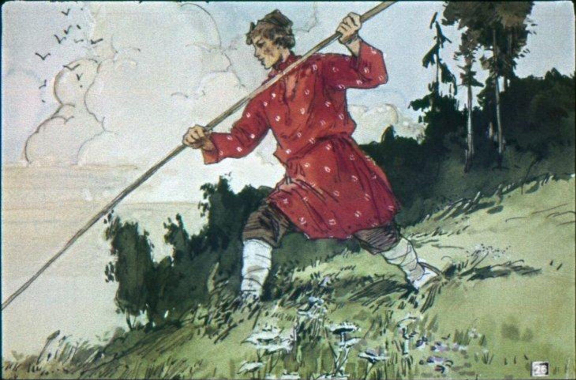
Илья разбежался да ковшом на жердине прямо в синюю шапку тумана и сунул.