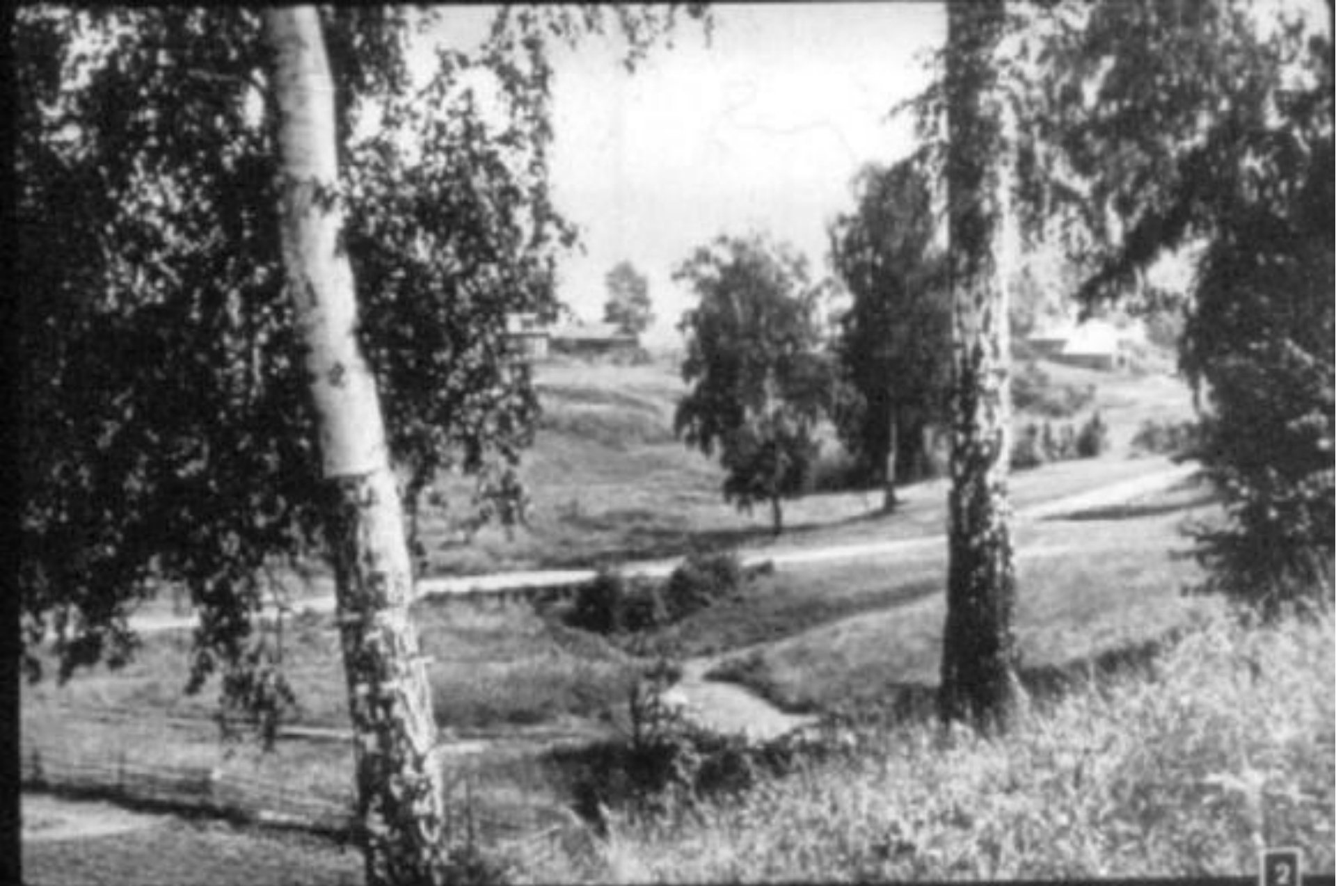
Жарний июльський полдень. Поля, перелески.