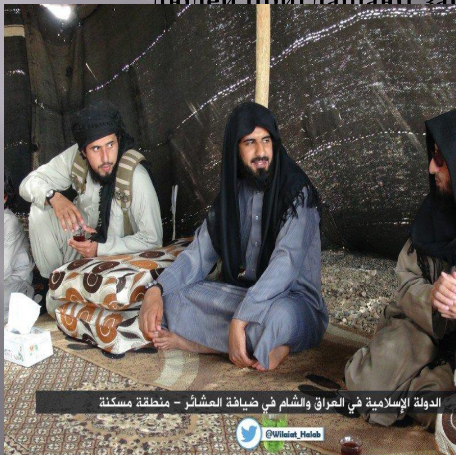
الدولة الإسلامية في العراق والشام في ضيافة العشائر - منطقة مسكنة

Повсеместно в Сирии можно услышать слово tafaddal ( что приблизительно переводится как «добро пожаловать»), и незнакомых людей приглашают зайти выпить чашку чая.