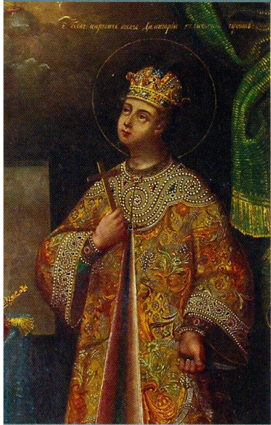
Д.Г. Буренин. Царевич Димитрий. 19в.