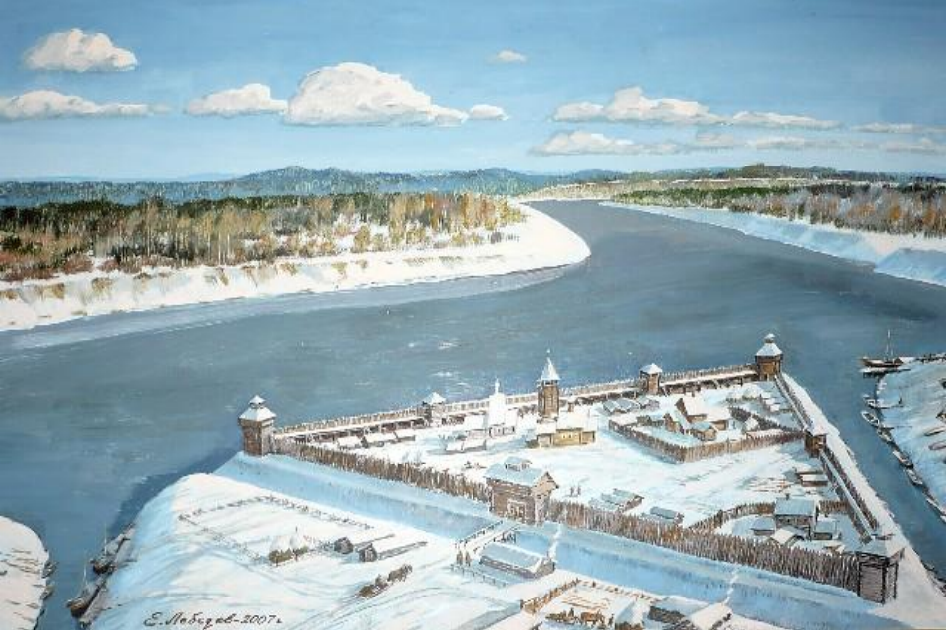
Лебедев Е.П., «Славянское поселение Угличе-поле 1148г.». 2007г.