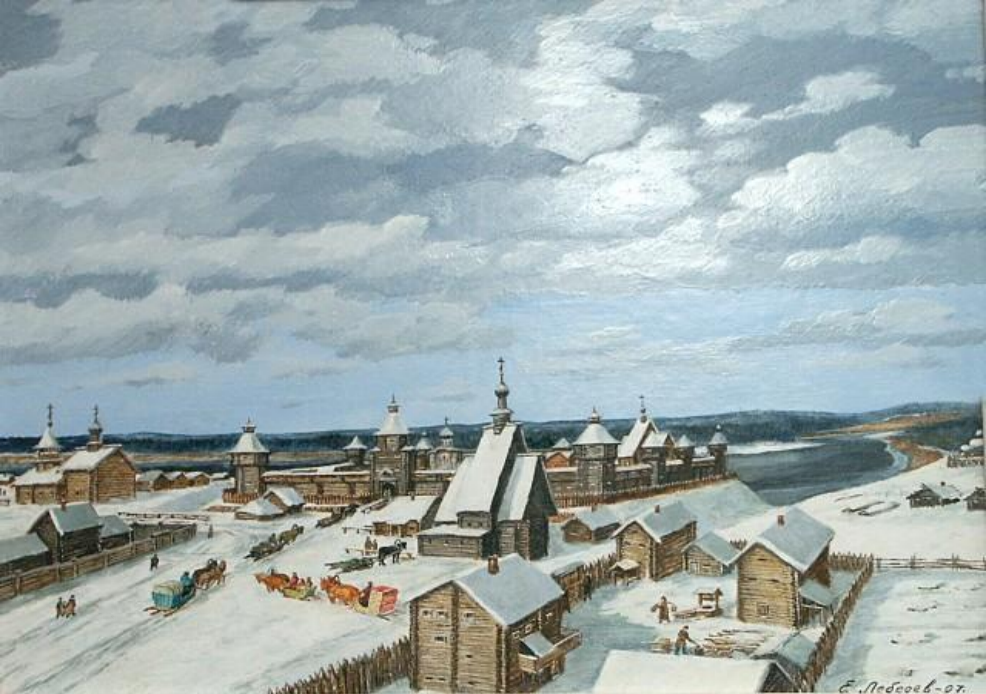
Лебедев Е.П. «Уglich 1650г.». 2007г.