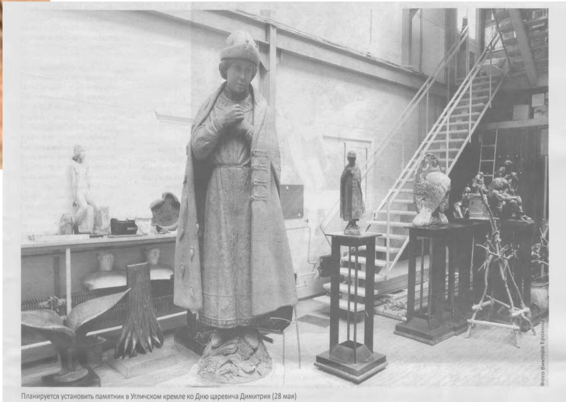
Планируется установить памятник в Угличском кремле ко Дню царевича Димитрия (28 мая)