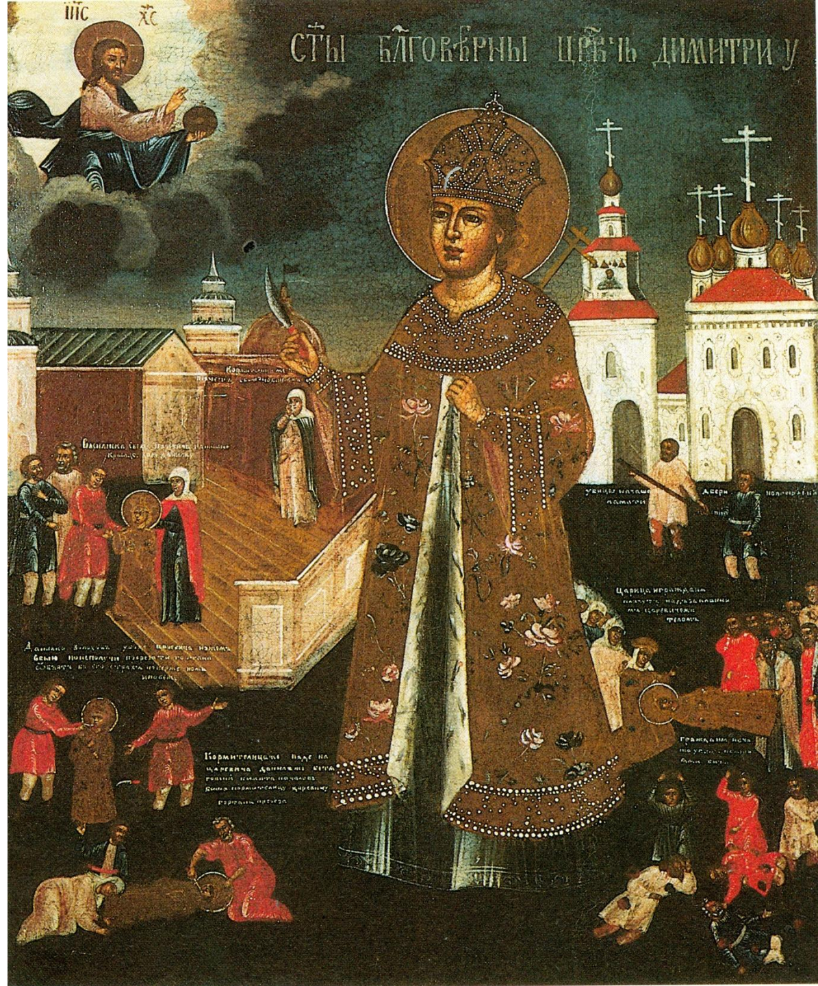
Икона «Царевич Дмитрий». 19в.