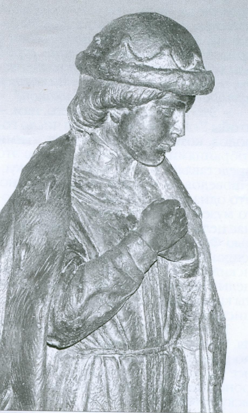
А. Рукавишников. Фрагмент памятника.