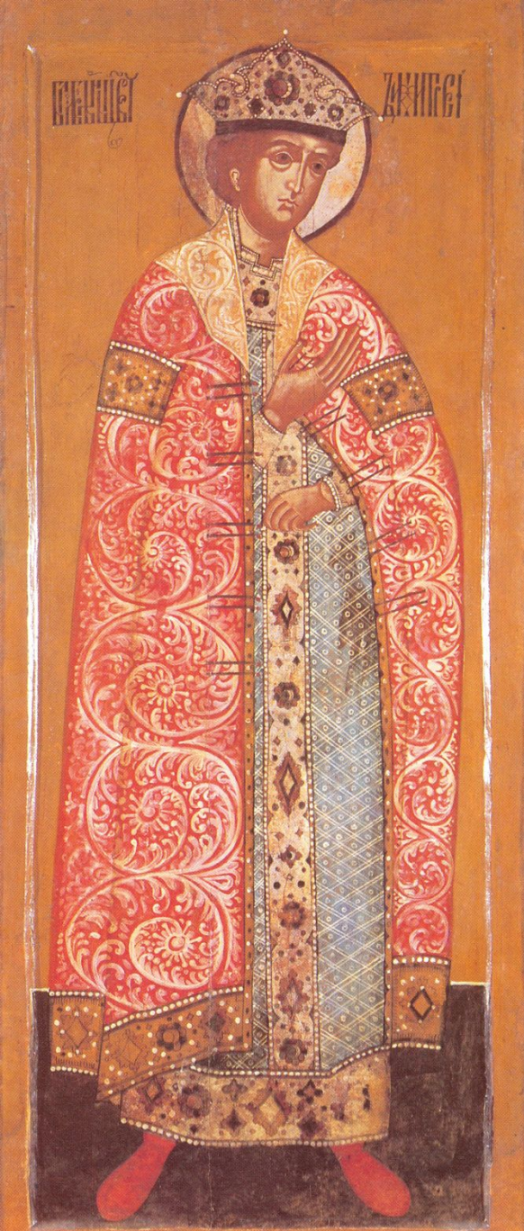
Икона «Царевич Дмитрий». 17в.