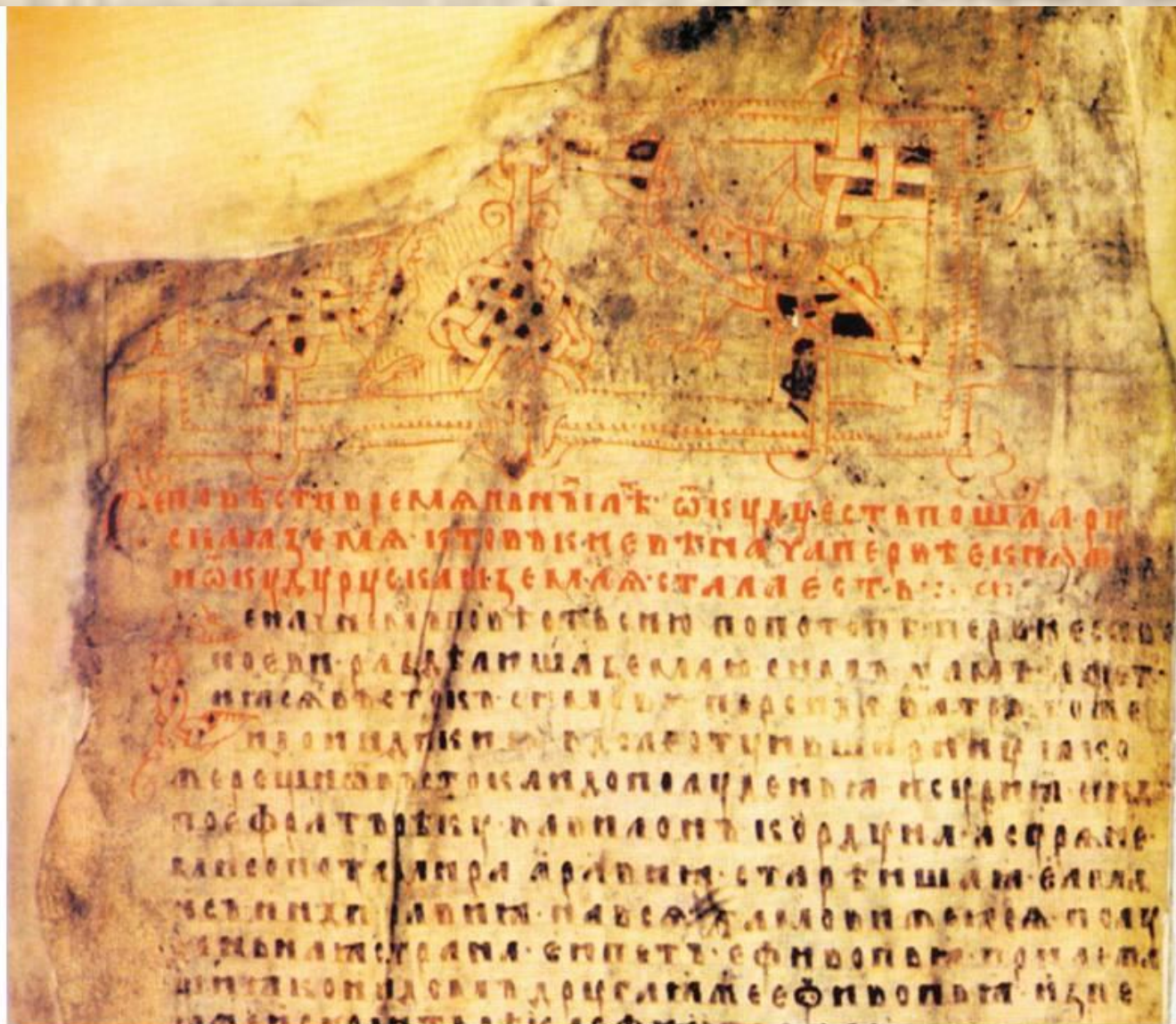
«Повесть временных лет» Нестора Летописца. Первый лист