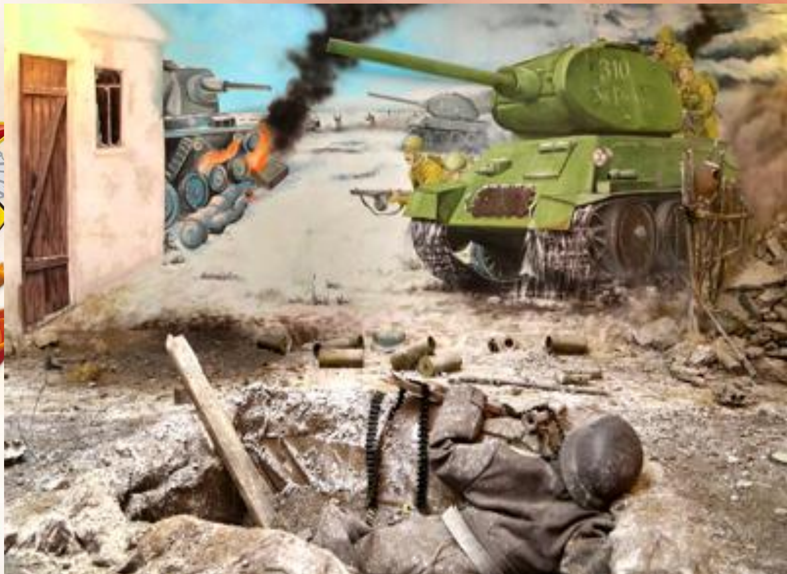
На фото фрагмент диорамы "Освобождение Тимашевского района" в музее семьи Степановых