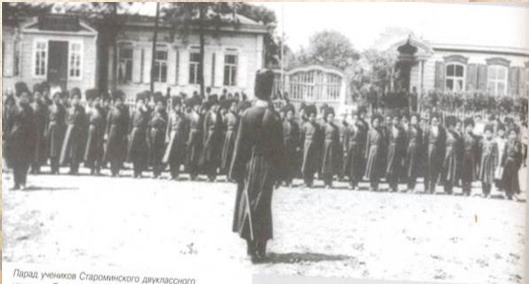
Парад учеников Староминского двухклассного