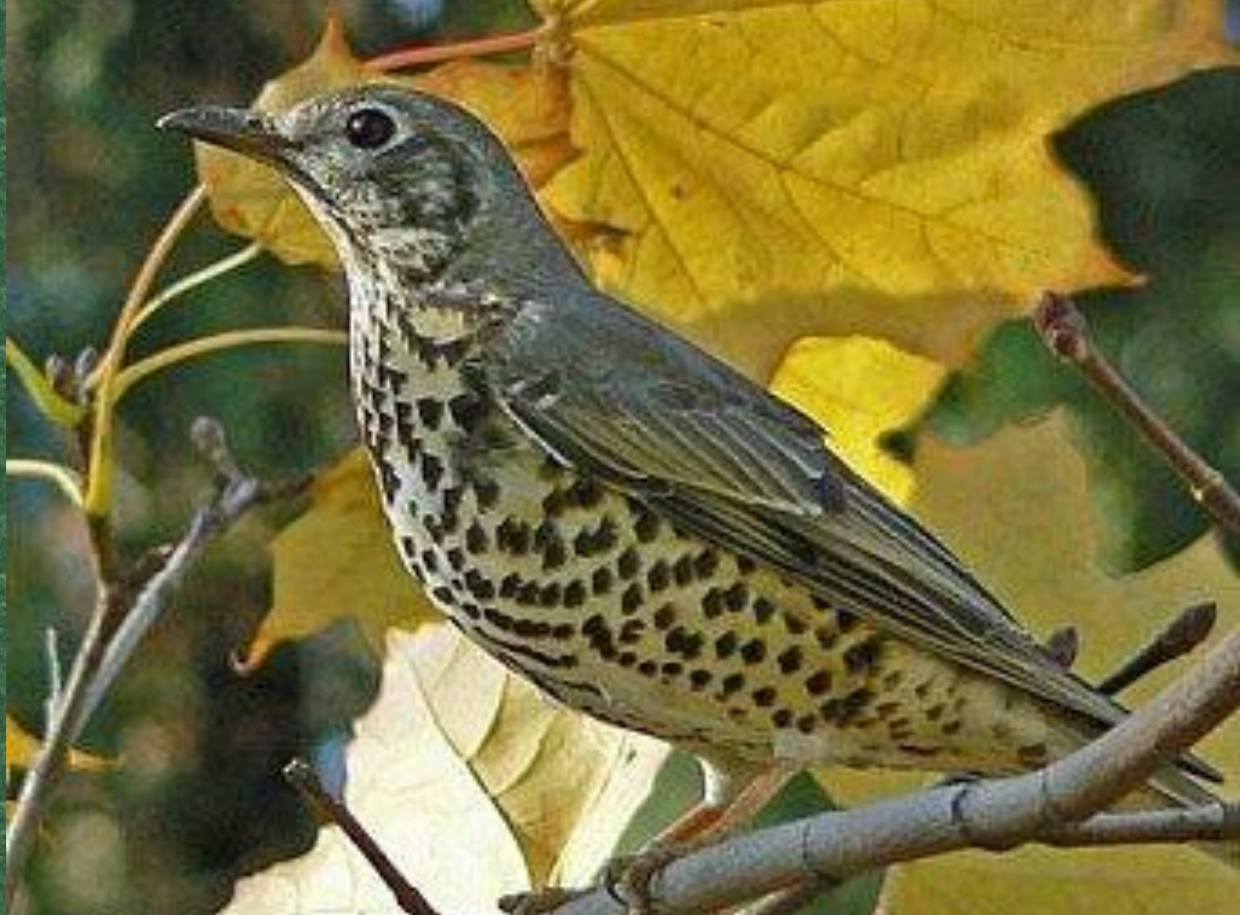
Пестрый каменный дрозд