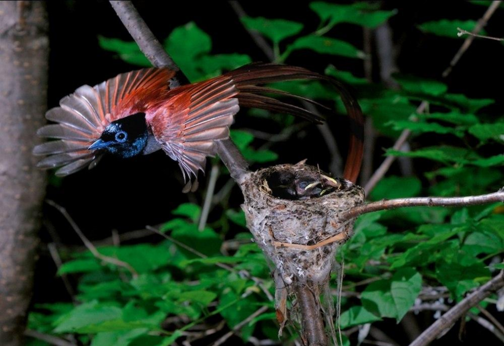
Райская или длиннохвостая мухоловка