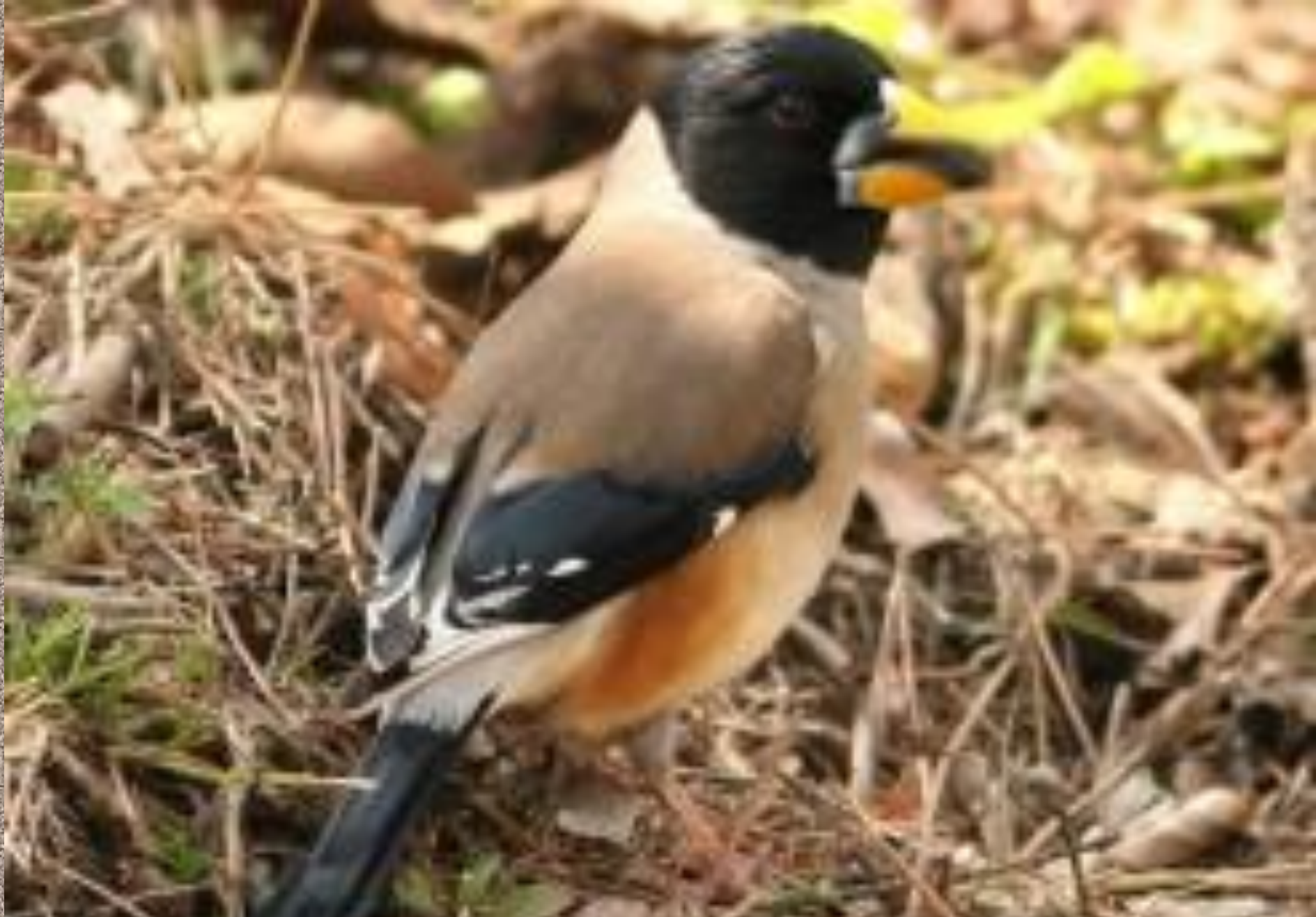
Малый черноголовый дубонос