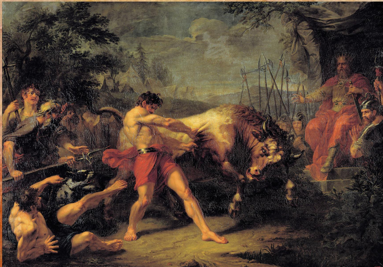
Г.И.Угрюмов. Испытание силы Яна Усмаря.

На картинах этих художников мы видим характерные для живописи классицизма героические сюжеты, весьма неестественные позы и патетические жесты персонажей. В композициях картин отчетливо просматривается искусственность и надуманность.