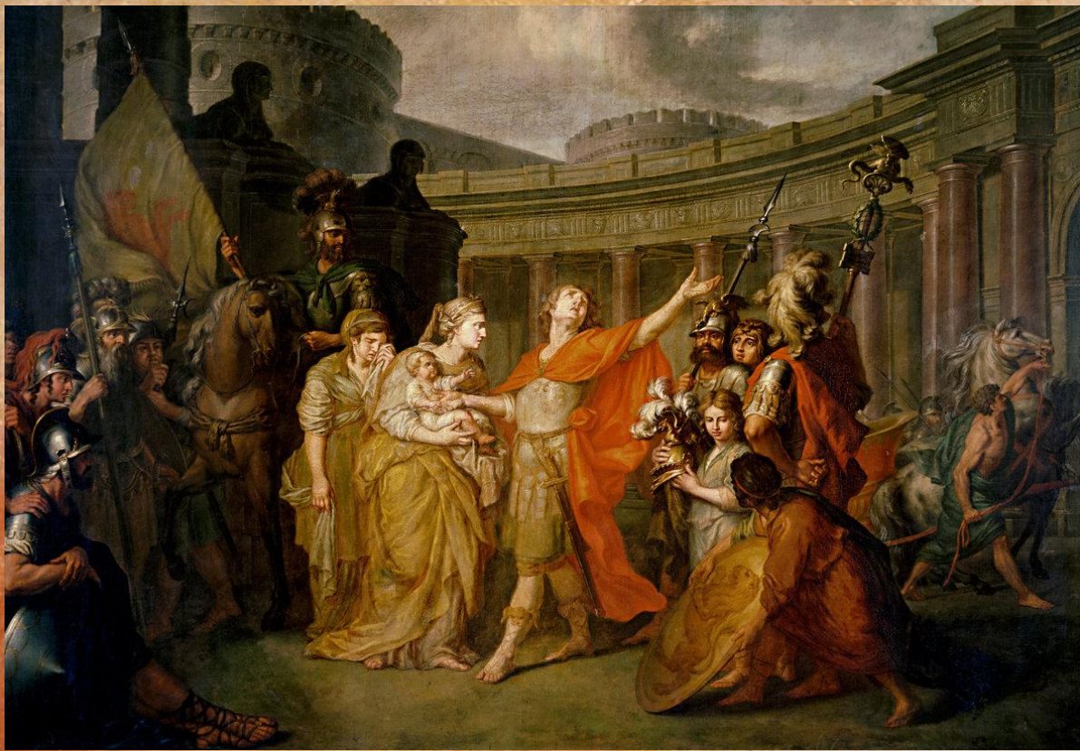
А.П.Лосенко. Прощание Гектора с Андромахой.

Русская живопись эпохи классицизма не проявлялась в «чистом виде», смешиваясь с другими стилями того времени. Наиболее зримо классицизм проявился в историческом жанре живописи, а среди художников, работавших в этом жанре, можно выделить имена А. П. Лосенко, Г. И. Угрюмова, И. А. Акимова