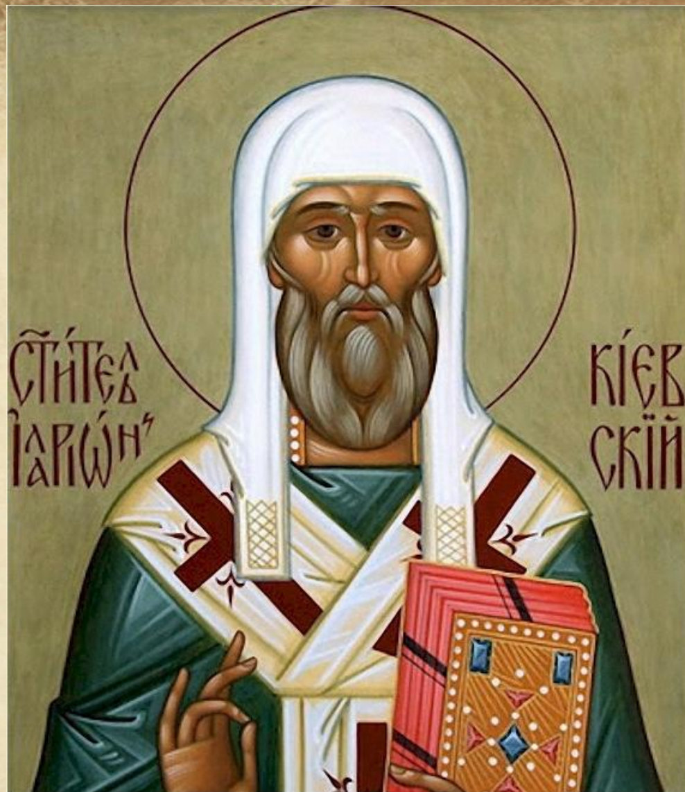
Митрополит Иларион, автор «Слова о законе и благодати», датируемого серединой XI в.