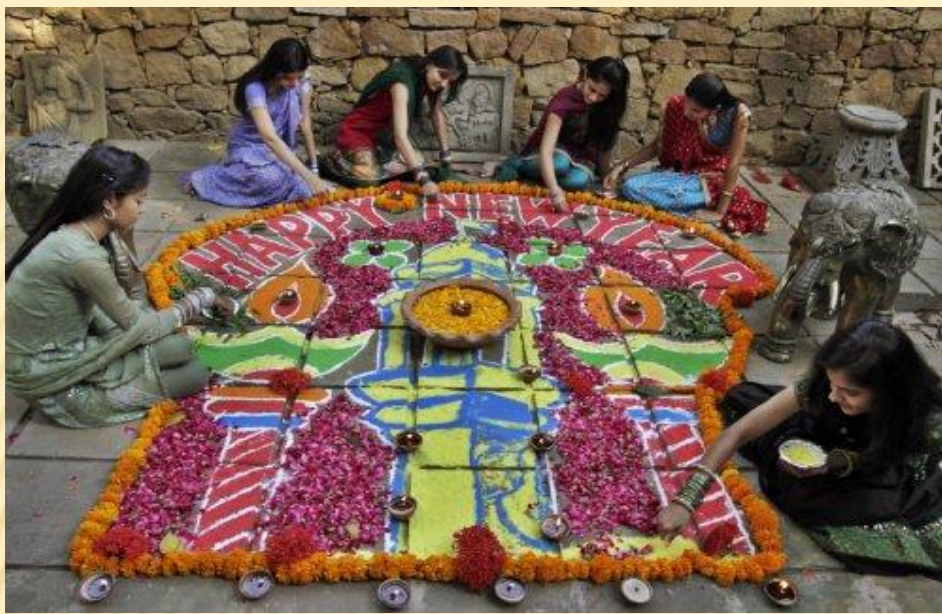
Завершение работы над Ранголи - узором на полу.