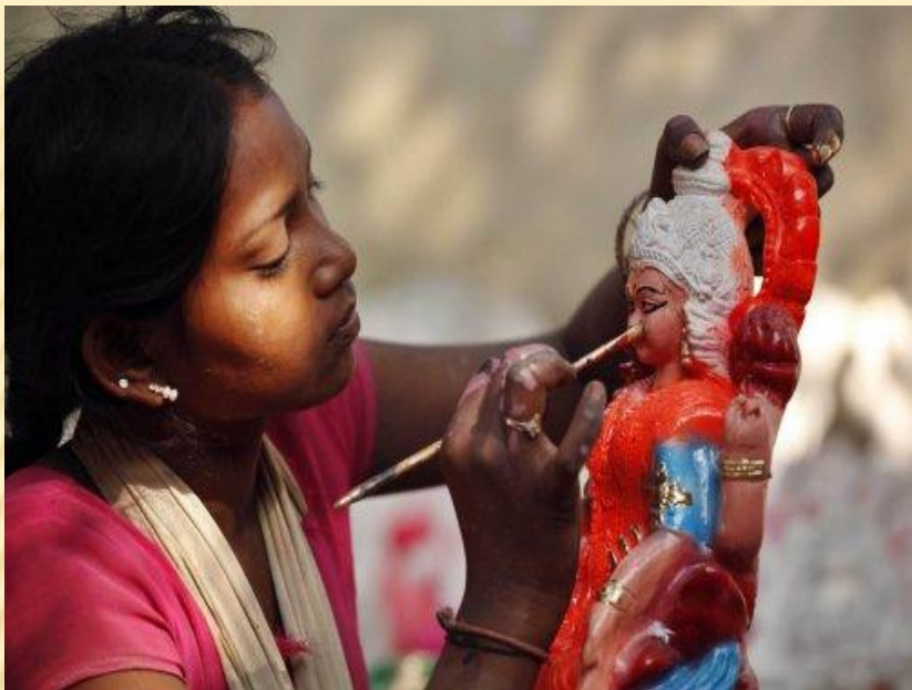
Статуэтка богини Лакшми - богини изобилия и процветания.