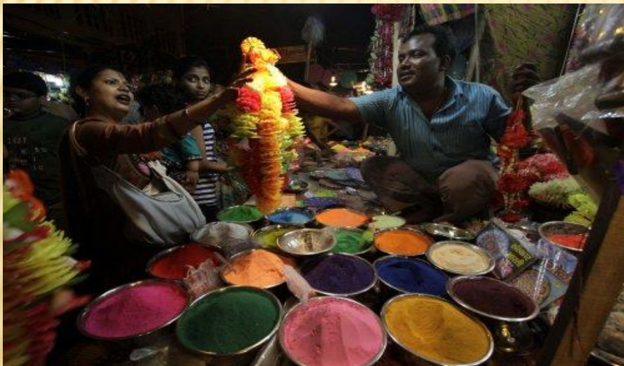
Женщины выбирают украшения.