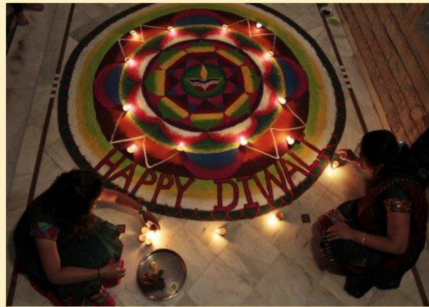
Индуски расставляют свечи вокруг узора ранголи.