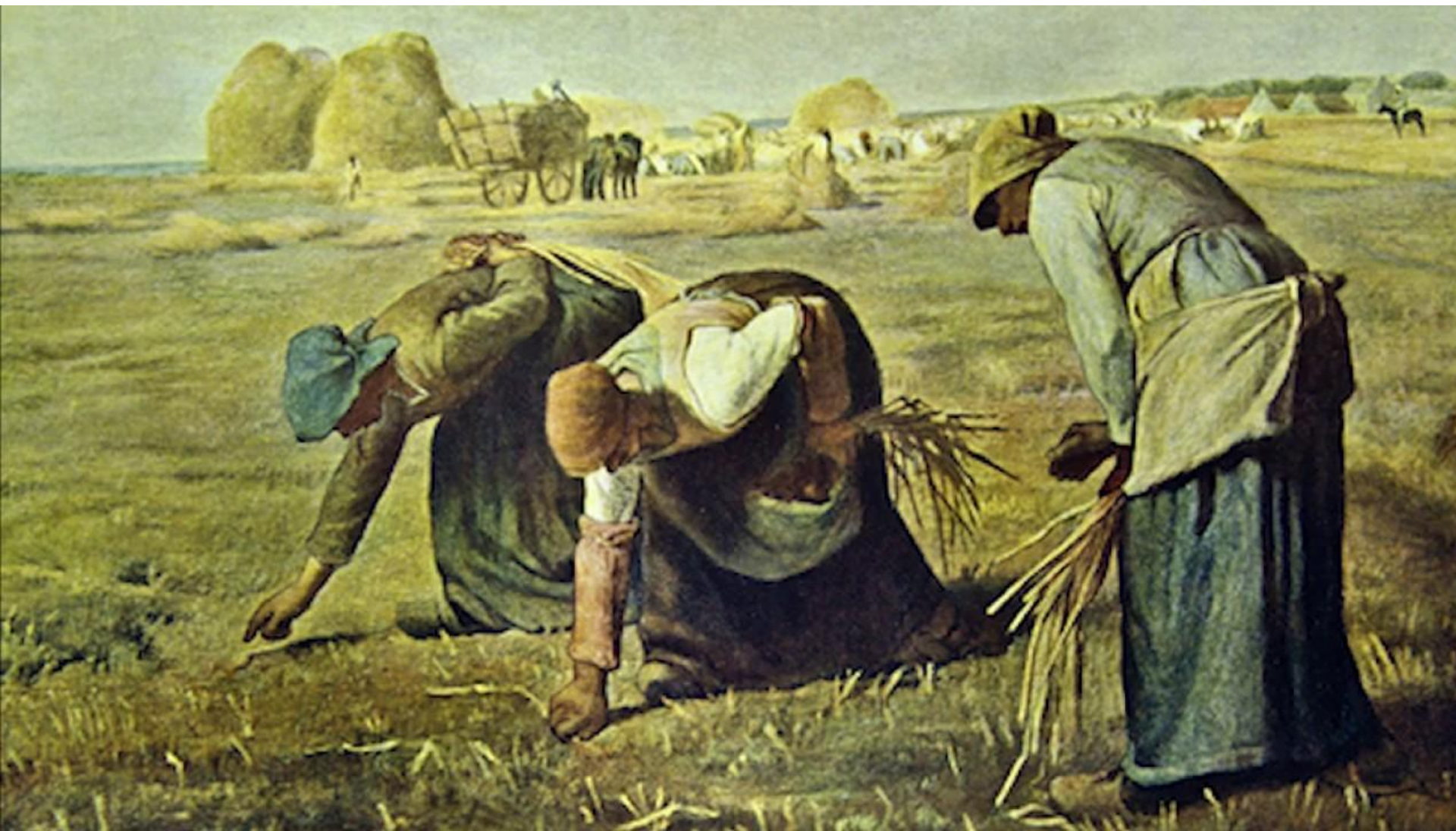
Ж.Ф.Милле «Сборщицы колосьев»