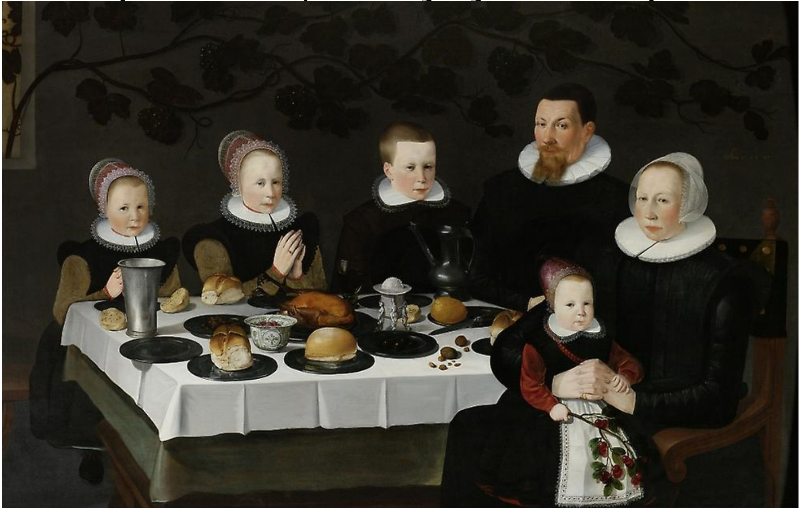
Неизвестный голландский художник 1627г.

«Перед тем, как заснуть, вспомните, что было сделано за день, ...ибо лучше потерять сон, чем упустить время»