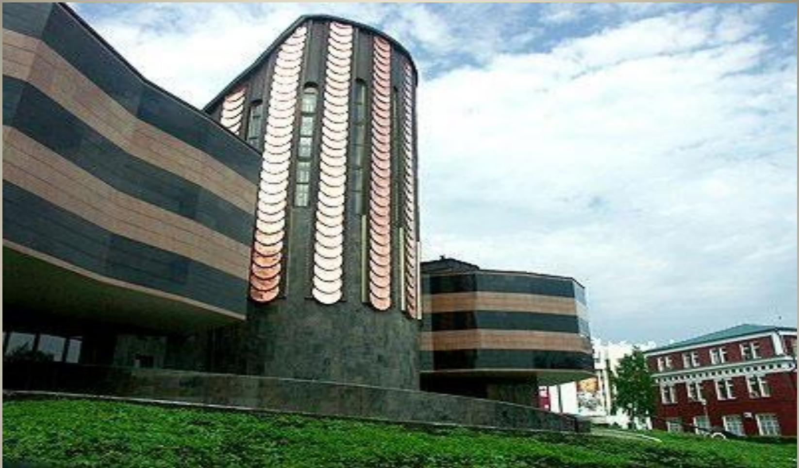
Музей боевого и трудового подвига 1941-1945 гг