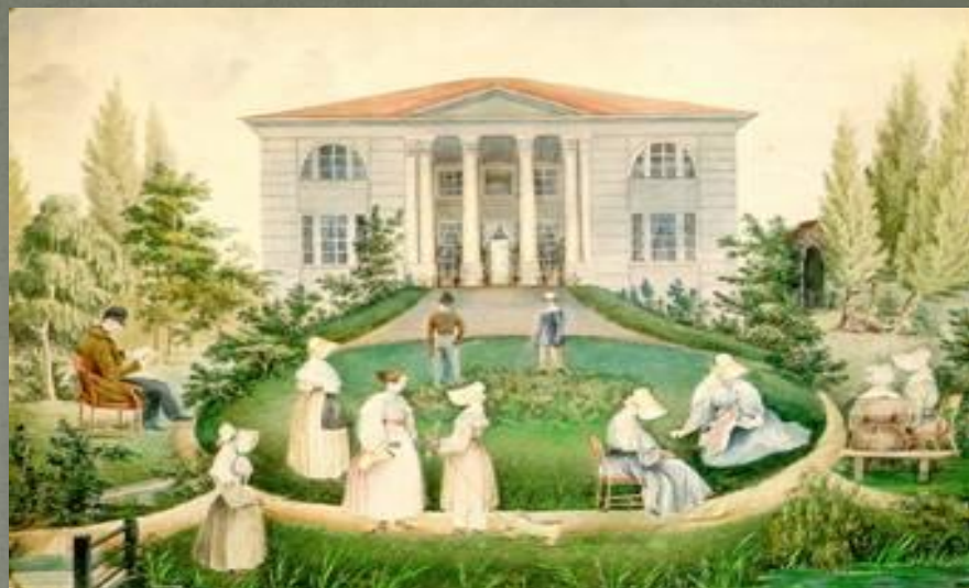
Прилучино (имение Муромских)