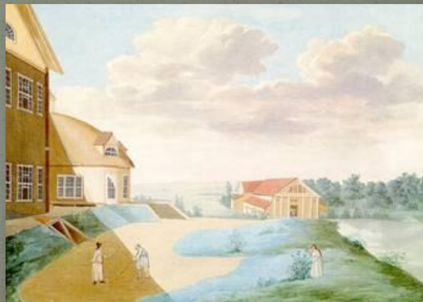
Тугилово (имение Берестовых)