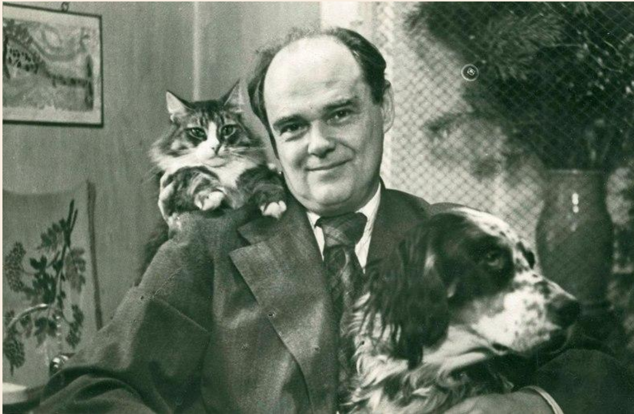
Евгений Иванович Чарушин